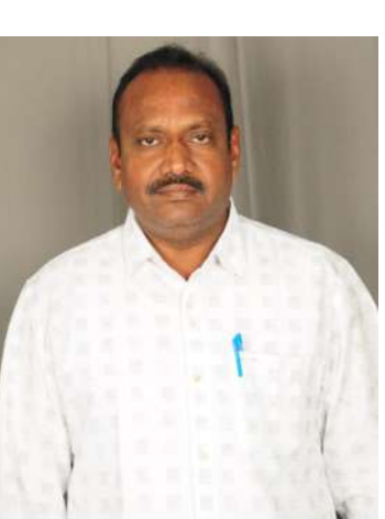
2018 నుండి అమలు చేసిన తీవ్ర సాఫ్ట్ వేర్ గురి చేశారన్నారు. సంస్థ భారీ లాభాలు ఆర్జిస్తున్నా, విశ్రాంత కార్మికుల సంక్షేమం పూర్తిగా ప్రభుత్వ ఉద్యోగులకు 2017 నుండి ప్రతి మూడు సంవత్సరాలకు ఒకసారి పెన్షన్ సమీక్ష తప్పనిసరిగా జరపాలని