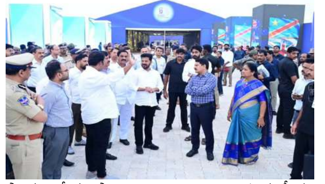
ప్రాంగణంలో గంటపాటు అన్ని అంశాలపై అధికారులకు కీలక సూచనలు చేశారు ముఖ్యమంత్రి రేవంత్ రెడ్డి. కార్యక్రమంలో ఎమ్మెల్యే మల్ రెడ్డి రంగారెడ్డి, జయవీర్ రెడ్డి, పూర్వం సిటీ ప్రత్యేక అధికారి శంకర్, ఇతర అధికారులు పాల్గొన్నారు