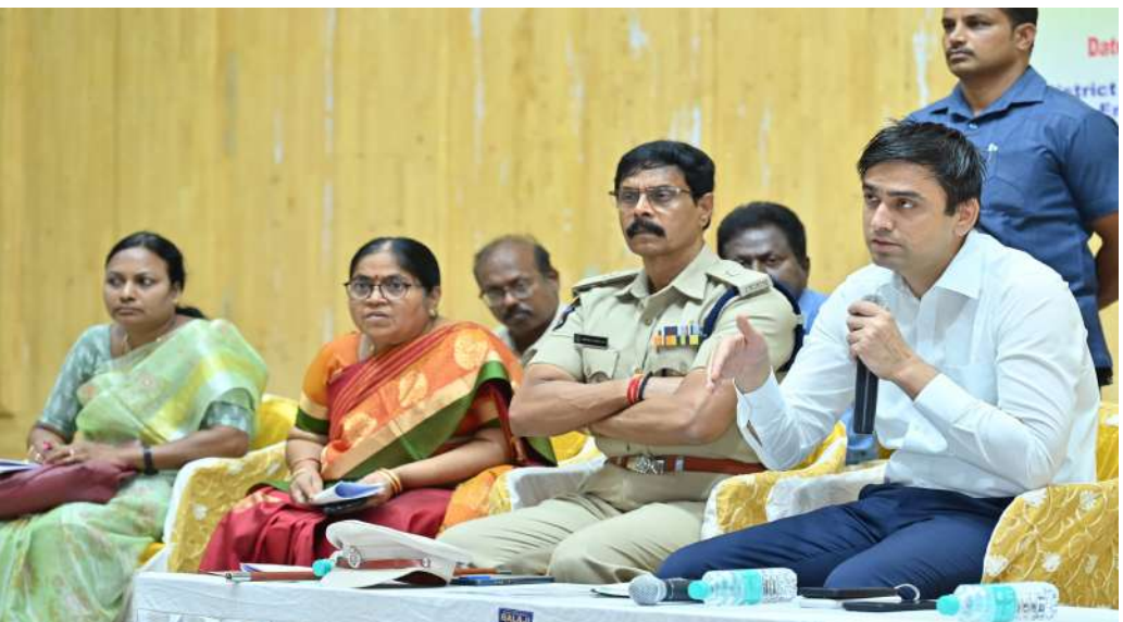
గ్రామ/వార్డు స్థాయిలో బాల సంక్షేమ పరిరక్షణ కమిటీ, బాల్యవివాహ నిరోధక మరియు పర్యవేక్షణ కమిటీ సమావేశాలు నిర్వహించాలి. ఈ సమావేశాల మినీట్స్ను జిల్లా బాల పరిరక్షణ యూనిట్ కు డి సి పి యునుమయానుకూలంగా సమర్పించాలి. మహిళా పోలీసులకు చిత్తూరు పరిరక్షణ కేంద్రాల మరియు పాఠశాలలు సందర్శన వెళ్ళే మరియు విద్యాశాఖల ద్వారా సదుపధి బాల సంరక్షణ కేంద్రాలు, వసతి పాఠశాలల్ని క్రమం తప్పకుండా సందర్శించాలి. బాలల రక్షణ కోణంలో భద్రమైన మరియు అనురక్షిత స్పర్శలపై అవగాహన