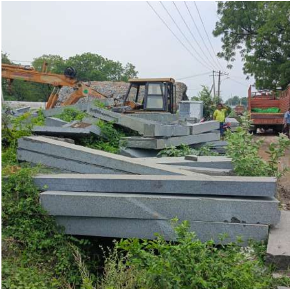
పెద్ద బండరాళ్లు తొలగించి పూడికలు తీయించారు. అక్రమణలు తొలగించారు. దీంతో ముంపు సమస్య తప్పింది.