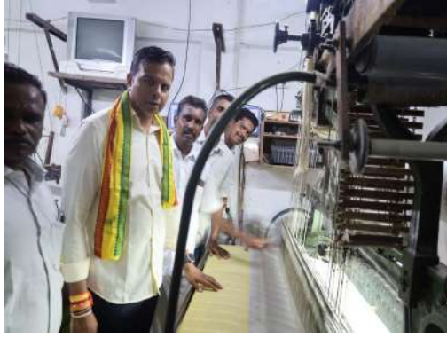
గాలి బాస ప్రకాష్ 500 యూనిట్లు మరియు 200 యూనిట్లు పథకాన్ని సత్రవాడ నడిబొడ్డున లాంచనంగా ప్రారంభించారు. ఈ కార్యక్రమంలో చేనేత కార్మికులు మరియు కార్యకర్తలు, నాయకులు, ప్రజాప్రతినిధులు పాల్గొనడం జరిగింది.

పుత్తూరు సమీపంలోని మూలకోన వద్ద ఏకో టూరిజం ప్రారంభించారు. సత్రవాడలో జరిగిన చేనేత కార్మికుల ఉచిత విద్యుత్ కార్యక్రమానికి అర్చన రూరల్ తెలుగుదేశం, జనసేన, బిజెపి నాయకులతో పాటు అధికారులు పాల్గొన్నారు. జాతీయ చేనేత దినోత్సవం గురించి చెప్పుకోవాలంటే 2015 వ సంవత్సరం ఆగస్టు 7 వ తేదీ ప్రధానమంత్రి నరేంద్ర మోడీ ప్రతి సంవత్సరం ఆగస్టు 7వ తేదీని చేనేత జాతీయ దినోత్సవం గా జరుపుకోవాలని అధికారికంగా ప్రకటించారు. జాతీయ చేనేత దినోత్సవం ప్రత్యేకం ఏమిటంటే స్వతంత్ర ఉద్యమానికి ముందు విదేశీ వస్తువుల బహిష్కరణ, స్వదేశీ వస్తువులను ప్రోత్సహించడం, అనే నినాదంతో అప్పుడే మొదలైంది అందుకే మరమగ కార్మికులకు ప్రోత్సాహకాలిస్తూ ఈరోజు అశేష చేనేత కార్మికుల మధ్య కూటమి ప్రభుత్వం నిర్ణయం మేరకు స్థానిక శాసనసభ్యులు