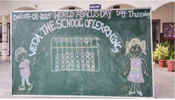
అక్షర విజేత చిలకలూరిపేట