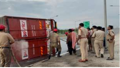
అదుపుతప్పిన ట్రక్ బోల్టా పడడంతో మంటలు చెర్రేగాయి. అతి కష్టం మీద గ్లాస్ ని పగలగొట్టి బయటకు దూకిన డ్రైవర్ ప్రాణనష్టం జరగలేదు.