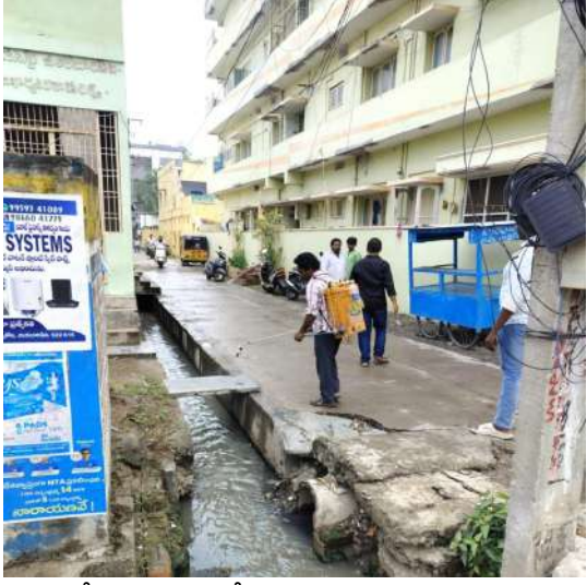
అక్షర విజేత చిలకలూరిపేట

ప్రజారోగ్య పరిరక్షణకు దోమల మందు పిచికారి-అధికారుల స్పందనపై ప్రజల హర్షం