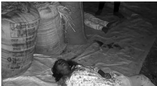
ప్రారంభించాలి అని ప్రజలు, రైతు సంఘాలు డిమాండ్ చేస్తున్నాయి. లేకపోతే ఇలాంటి ప్రమాదాలు మరన్ని అమాయక ప్రాణాలను బలితీసుకునే ప్రమాదం ఉందని హెచ్చరిస్తున్నారు.

న్నారు. అయితే ఈ పరిస్థితిపై సంబంధిత అధికారులు కేవలం హెచ్చరికలు జారీ చేయడానికే పరిమితమవుతున్నారని, క్షేత్రస్థాయిలో శాశ్వత పరిష్కారాలపై దృష్టి సారించడం లేదని సామాజిక వర్గాల నాయకులు మండిపడుతున్నారు.రైతులకు వడ్ల ఆరబెట్టుకునే ప్రత్యేక స్టలాలు, డ్రెయింగ్ యార్డులు, తాత్కాలిక వేదికలు ఏర్పాటు చేయడంలో ప్రభుత్వం పూర్తిగా విఫలమైందని విమర్శలు వెల్లువెత్తుతున్నాయి. అంతేకాకుండా, రహదారులపై ధాన్యం ఆరబెట్టడం వల్ల కలిగే ప్రమాదాలపై రైతులకు తగిన అవగాహన కల్పించడంలో వ్యవసాయ, రెవెన్యూ, పోలీసు శాఖలు సమన్వయంతో పనిచేయలేదని స్థానికులు ఆరోపిస్తున్నారు.ఇప్పటికైనా ప్రభుత్వం స్పందించి గ్రామాల్లో సురక్షిత ధాన్యం ఆరబెట్టే సదుపాయాలు కల్పించడంతో పాటు, వెంటనే పరి కొనుగోలు కేంద్రాలను