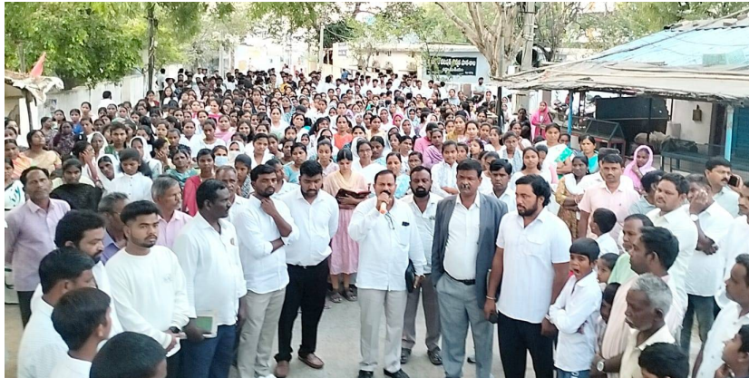
అమరచింత ఏప్రిల్ 5 (వార్త నిర్వయం)

ఈస్టర్ పర్వదినాన్ని పురస్కరించుకొని ఎం.బి కార్టల్ సంఘం ఆధ్వర్యంలో ఆదివారం పురవీధుల్లో శాంతి ర్యాలీ ఘనంగా నిర్వహించారు. అనంతరం కల్వరి కొండ దగ్గర ప్రత్యేక ప్రార్థనలు నిర్వహించారు. పునరుత్థానం చేసిన మహోన్నత రోజు ఈస్టర్ అని, క్రైస్తవులు పునరుత్థాన శక్తితో ఆధ్యాత్మికంగా పునీతులు కావాలని క్రైస్తవ మత పెద్దలు ఉద్ఘోషించారు.