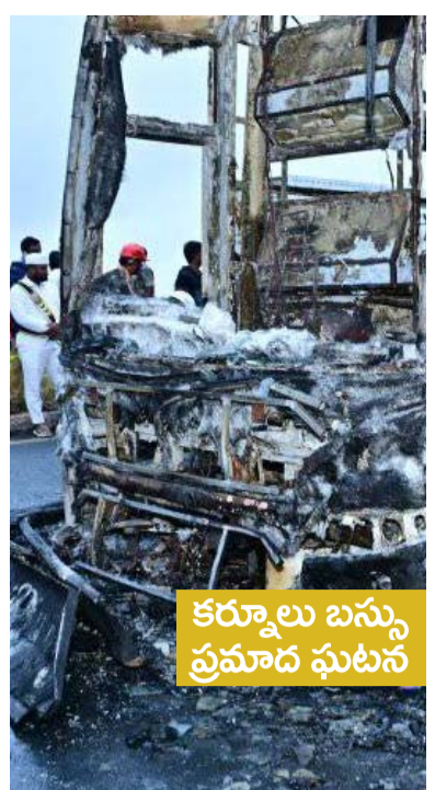
కర్నూలు బస్సు ప్రమాద ఘటన

సంపుటి : 04 సంఛిక : 114 పేజీలు 8 వెల : 5 శనివారం 25 అక్టోబర్ 2025