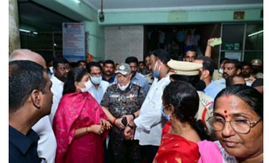
కర్నూలు శివారులో ఘోర బస్సు ప్రమాదం మంటల్లో కాలి బూడిదయిన బస్సు ప్రమాదంలో 19 నిండు ప్రాణాలు బుగ్గి బైకును డ్రీకొని తగులబడ్డ బస్సు ప్రమాదం గుర్తించని డ్రైవర్లు బతికిబయటపడ్డ 22మంది పలువురికి గాయాలు.. ఆస్పత్రిలో చికిత్స