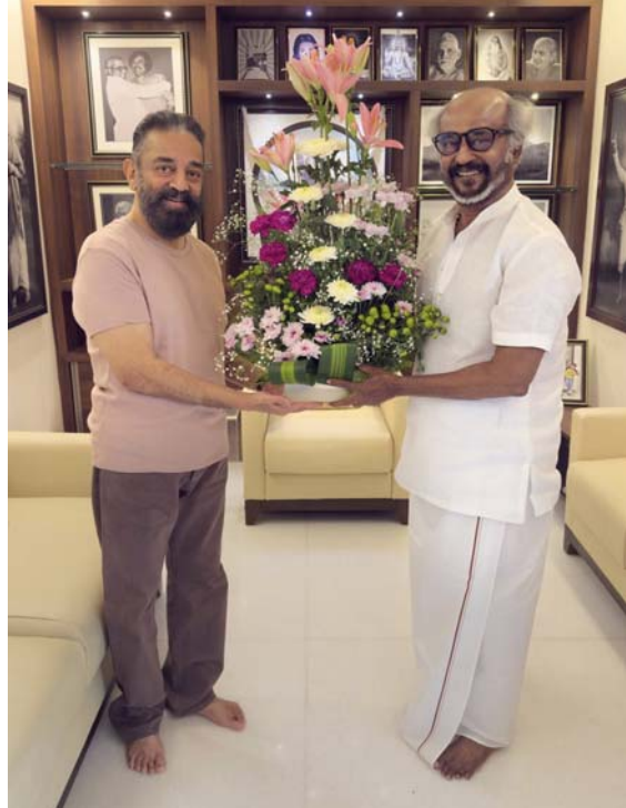
గురించి ఇంతకంటే ఏం చెప్పలేనని అన్నారు. నేను రజనీకాంత్ కు వీరాభిమానిని. ఇప్పటివరకూ విడుదలైన ఆయన సినిమాలు

తాను దర్శకత్వం వహించడం లేదన్న ప్రదీప్ రంగనాథ్ అగ్ర కథానాయకులు రజనీకాంత్, కమల్ హాసన్ 46 ఏళ్ల తర్వాత కలిసి స్క్రీన్ పంచుకోనున్న విషయం తెలిసింది. ఈ ప్రాజెక్ట్ అధికారికమైనప్పటినుంచి దీనికి సంబంధించిన అనేక వార్తలు సోషల్ మీడియాలో వైరల్ గా మారాయి. కోల్డ్ షూట్ దర్శకుడు ప్రదీప్ రంగనాథ్ ఈ సినిమాకు దర్శకత్వం వహించనున్నట్టు వార్తలు వచ్చాయి. తాజాగా దీనిపై ఆయన స్పందిస్తూ... తాను ఈ ప్రాజెక్ట్ లో భాగం కాదని తెలిపారు. ఆ సినిమాకు నాకు దర్శకత్వం ఆఫర్ వచ్చిందో, లేదో కూడా నేను చెప్పను. కానీ, నేను ఈ ప్రాజెక్ట్ లో భాగం కాదు. ఎందుకంటే ప్రస్తుతం దర్శకత్వం మీద కంటే యాక్టింగ్ మీదే ఫోకస్ పెట్టాలనుకుంటున్నాను. కమల్-రజనీకాంత్ మల్లీస్వారర్