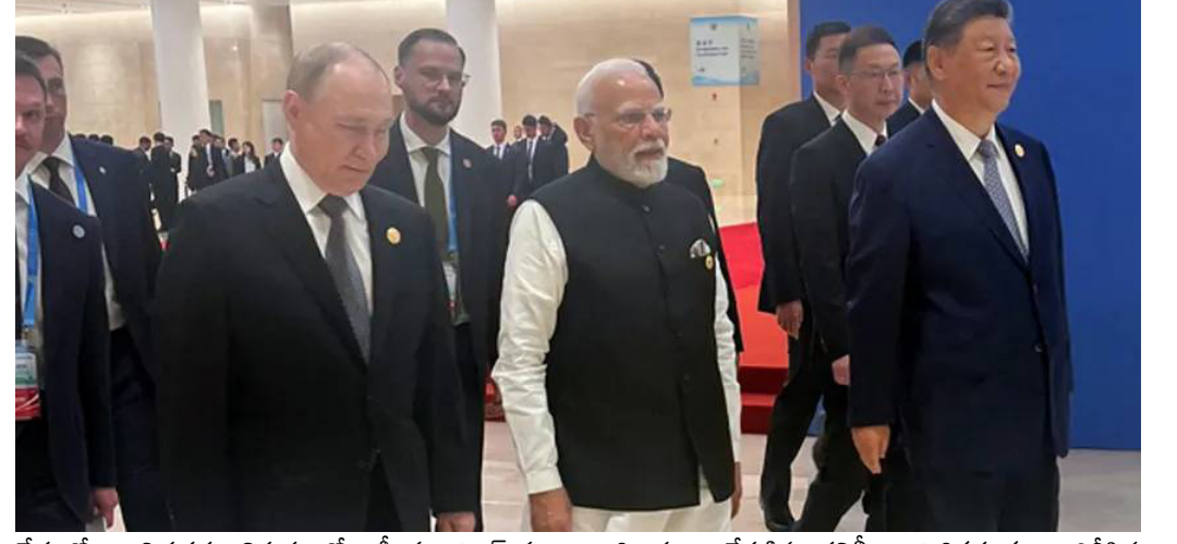
దేశంలో శాంతిభద్రతల విషయంలో ఇటీ-వల బ్రువ్ పలు కీలక నిర్ణయాలు తీసుకున్నారు. అందులో భాగంగా షికాగో, న్యూయార్క్ లో నేషనల్ గార్డ్స్ ను మోహించి యేచనలో ఉన్నట్లు - తెలిపారు. ఆయన ప్రకటనపై తీవ్ర విమర్శలు వ్యక్తమయ్యాయి. కాగా.. అక్రమ వలసదారుల విరివేత లక్ష్యంగా ఇటీ-వల లాన్ ఏంజెలెస్ లో ఫెడరల్ అధికారులు చేపట్టిన తనిఖీలు ఉద్రిక్తతలకు దారితీసిన విషయం తెలిసిందే. ఆ సమయంలో బ్రువ్ అక్కడికి నేషనల్ గార్డు బృందాలను తరలించారు. నాడు న్యూసమ్ దీన్ని తీవ్రంగా ఖండించారు. ఇటీవల దేశ రాజధాని వాషింగ్టన్ లో కూడా నేషనల్ గార్డ్ బలగాలను మోహించుకున్నట్లు - బ్రువ్ ప్రకటించారు.

శాన్ ఫ్రాన్సిస్కో, సెప్టెంబర్ 2 (తెలుగు రేఖ): భారీ సుంకాల విధింపు నేపథ్యంలో భారత్ - అమెరికా మధ్య సంబంధాలు దెబ్బతిన్నాయి. ఈ క్రమంలో భారత ప్రధాని సరేంద్ర మోడీ చైనాలో వర్షులించడం.. ఆ దేశాధ్యక్షుడు జిన్ పింగ్, రష్యా అధినేత వ్లాదిమిర్ పుతిన్ లతో భేటీ కావడం ఆసక్తి రేకెత్తించాయి. ఈ ముగ్గురు అధినేతలు కలిసి ఉన్న వీడియోను కాలిఫోర్నియా గవర్నర్ గవిన్ న్యూసమ్ ఎక్స్ లో పోస్టు చేసి.. అమెరికా అధ్యక్షుడు డొనాల్డ్ ట్రంప్ నకు కౌంటర్ ఇచ్చారు. ఎస్ సిఐ సదస్సు నేపథ్యంలో మోడీ, జిన్ పింగ్, పుతిన్ ల కలుసుకున్నారు. ఈ క్రమంలో రష్యా అధినేత, భారత ప్రధాని చేతులు పట్టు-కొని నడుస్తూ.. జిన్ పింగ్ వద్దకు వెళ్తున్న వీడియోను న్యూసమ్ పోస్టు చేశారు. దీనికి భయపడకండి.. బ్రువ్ తన గార్డెలును షికాగోకు పంపుతున్నామని అని రాసుకొచ్చారు. షికాగోలో నేరాలు, ఆక్రమ వలసలను అరికట్టడంలో బ్రువ్ ప్రణాళికలపై ప్రతిష్టంభన నెలకొంది. ఈ క్రమంలో బ్రువ్ ను విమర్శిస్తూ.. న్యూసమ్ ఈ పోస్టు చేసినట్లు - తెలుస్తోంది.