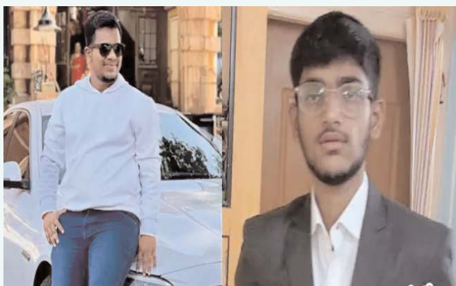
హైదరాబాద్, సెప్టెంబర్ 2 (తెలుగు రేఖ):

- రోడ్డు ప్రమాదంలో ఇద్దరు హైదరాబాద్ మృతి