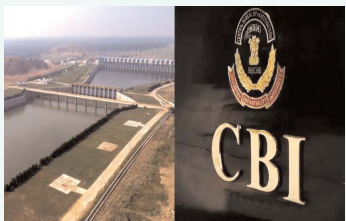
హైదరాబాద్, సెప్టెంబర్ 2 (తెలుగు రేఖ):

కాశీశ్వరంపై నేషనల్ డ్యామ్ సీట్స్ అధారితీ ఎన్డీఎస్ నివేదిక ఆధారంగా సీబీఐ విచారణకు తెలంగాణ ప్రభుత్వం సిఫారసు చేసింది. ఈ మేరకు కేంద్ర హోంశాఖకు రాష్ట్ర ప్రభుత్వం లేఖ రాసింది. కాశీశ్వరం ప్రాజెక్టు నిర్మాణంలో లోపాలు ఉన్నట్లు - ఎన్డీఎస్ గుర్తించింది. ప్రణాళిక, డిజైన్, నాణ్యత, నిర్మాణంలో లోపాలు ఉన్నాయని ప్రభుత్వం పేర్కొంది. అందుకే ఈ అంశంపై సీబీఐతో విచారణ జరిపించాలని కోరింది. జస్టిస్ పీఐ ఘోష్ కమిటీ - కూడా విచారణ జరిపి లోపాలను గుర్తించింది తెలిపింది. ఎన్డీఎస్ నివేదికపై ఆసెంబ్లీలో చర్చించామని లేఖలో ప్రభుత్వం ప్రస్తావించింది. మరోవైపు రాష్ట్రానికి సీబీఐ చాకుండా గతంలో ఉన్న ఆదేశాలను సడలిస్తూ జీవ్ విడుదల చేసింది. సీబీఐ విచారణకు అన్నివిధాలుగా సహకరిస్తామని ప్రభుత్వం పేర్కొంది.