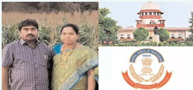
హైదరాబాద్, సెప్టెంబర్ 2 (తెలుగు రేఖ):