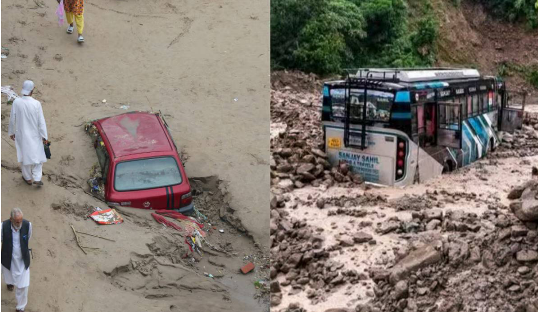
హోశియార్ పూర్, అమృత్ సర్ జిల్లాల్లోని పలు గ్రామాలు నీట మునిగాయి. ఈ ఆరు జిల్లాల్లో మంగళవారం వరకూ భారీ వర్షాలు కురుస్తాయని వాతావరణ శాఖ రెడ్ అలర్ట్ జారీచేసింది. పంజాబ్ లో వర్షాల కారణంగా పలు రైళ్లు రద్దయ్యాయి. రాష్ట్రంలోని 793 రోడ్లను మూసి వేశారు. ఈ నెల 3వరకు అన్ని విద్యాసంస్థలను మూసివేయాలని పంజాబ్ ప్రభుత్వం సోమవారం ఉత్తర్వులు ఇచ్చింది. రాజస్థాన్ రాజధాని జైపూర్ లో సహా పలు ప్రాంతాల్లో వర్షాలు విస్తారంగా కురుస్తున్నాయి. రాష్ట్రంలో పిడుగుపాటుకు ఇద్దరు మృతిచెందారు. ఒకరు నదీ ప్రవాహంలో కొట్టుకుపోయారు. జమ్మూ, పంజాబ్, హిమాచల్ ప్రదేశ్ లో వరదల్లో చిక్కుకొన్న 5 వేల మందిని, 300 మంది పారామిలటరీ రళాల నిబంధిని రక్షించామని సైన్యం తెలిపింది. పంజాబ్ లో ఎడతెరపి లేకుండా వర్షాలు కురుస్తున్న నేపథ్యంలో ఆ రాష్ట్ర గవర్నర్ గులాబ్ చంద్ కటారియాతో పాటు - ముఖ్యమంత్రి భగవంత్ మాన్ తో కేంద్ర హోం మంత్రి అమిత్ షా ఫోన్ లో మాట్లాడారు. మరోచెప్పు జమ్మూకశ్మీర్ లో వరద ప్రభావిత ప్రాంతాల్లో పర్వతీంచి అధికారులతో సమీక్షించారు. వరదల్లో నష్టపోయిన పంజాబ్, జమ్మూకశ్మీర్ లను కేంద్రం అన్ని విధాలా ఆదుకుంటుందని హామీ ఇచ్చారు.

న్యూఢిల్లీ, సెప్టెంబర్ 2 (తెలుగు రేఖ): ఉత్తరాది రాష్ట్రాల్లో భారీ వర్షాలు బీభత్సం సృష్టిస్తున్నాయి. వాగులు, వంకలు, నదులు ప్రమాదకర స్థాయిలో ఉధృతంగా ప్రవహిస్తున్నాయి. యమునా ఉధృతితో ఢిల్లీ నగరం నీట మునిగింది. ఇప్పటికే ఇక్కడికి నీరు చేరుతోంది. ఢిల్లీలోని యమునా నదిలో నీటిమట్టం క్రమంగా పెరుగుతోంది. నదీ ప్రవాహక ప్రాంతాల్లో నివసించే ప్రజలు సురక్షిత ప్రాంతాలకు వెళ్లాలని అధికారులు సూచించారు. ఉత్తరాఖండ్, హిమాచల్ ప్రదేశ్ లో కొండచరియలు విరిగిపడి ఎదుగురు మృతిచెందారు. రాష్ట్రంలో పలుచోట్ల ఎడతెరపి లేకుండా కురుస్తున్న వర్షాలతో సిమ్లాలోని వేర్వేరు ప్రాంతాల్లో కొండచరియలు విరిగిపడి తండ్రి, కుమార్తె సహా ఐదుగురు మరణించారు. ఉత్తరాఖండ్ లోని సోన్ ప్రయాగ్ గౌరికుండ్ మధ్య ఉన్న కేదార్ నాథ్ జాతీయ రహదారిపై కొండచరియలు విరిగిపడి ఇద్దరు మృతిచెందారు. ఆరుగురు గాయపడ్డారు. దీంతో ఈ నెల 3 వరకు కేదార్ నాథ్ యాత్రను అధికారులు తాత్కాలికంగా నిలిపివేశారు. ఉత్తరకాశీ జిల్లాలోని కమ్మ సదీత్ పాటు, దేప్రూమాలోని శాలినీ నది, తెన్రీ జిల్లాలోని అగ్రర్ నది, రుద్రదయాగ్ లోని అలకనందా, మందాకిని నదులు ప్రమాదస్థాయిని మించి ప్రవహిస్తున్నాయి. పంజాబ్, హరియాణా, చండీగఢ్ లోని పలు ప్రాంతాల్లో భారీ వర్షాలు కురిశాయి. లూథియాలో అత్యధికంగా 216.70 మిల్లీమీటర్ల వర్షపాతం నమోదైంది. పఠాన్ కోట్, గుర్దోవాసర్, ఫాజిల్వా, కపూర్ ఠలా, తరనోతర్, ఫిరోజ్ పూర్,