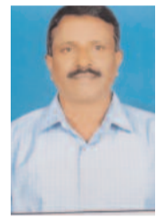
స్వర్ణసాగరం డోర్లకల్ సెప్టెంబర్.12

జిల్లాలో ఉన్న అన్ని ప్రభుత్వ మరియు ప్రైవేటు, ఐటిఐ లలో వివిధ రకాల గ్రేడులలో ఖాళీగా ఉన్నటువంటి సీట్లను నాలుగవ దశలో వాక్ ఇన్ అడ్మిషన్ ద్వారా తేదీ 15. 9. 2025 నుండి 30.9. 2025 మధ్యాహ్నం 1 గంట వరకు ని