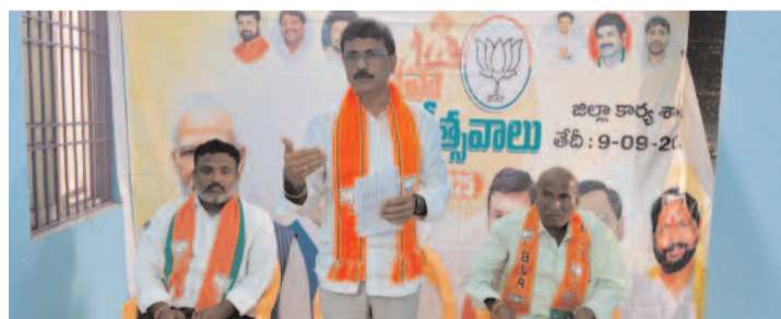
పెళ్లకూరు స్వర్ణసాగరం సెప్టెంబర్.12.