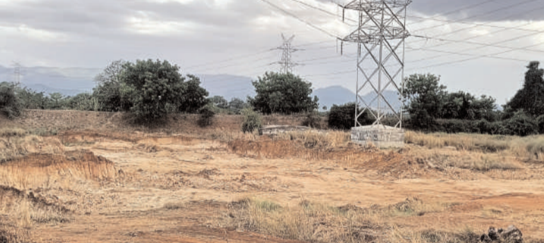
చెరువుల్లో కరకట్టలు.. విద్యుత్ టవర్లకు ప్రమాదకర తవ్వకాలు