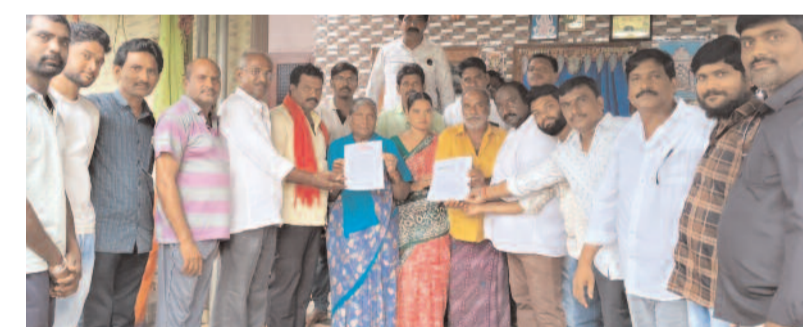
కొయ్యలగూడెం స్వర్ణ సాగరం