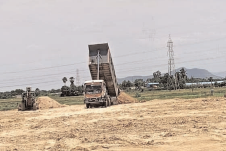
భారీ వాహనాలతో ప్రైవేటు వెంచర్లకు తరలిస్తున్న మట్టి