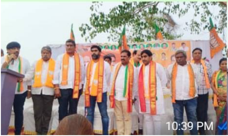
ఏలూరు జిల్లా ముదినేపల్లి.....కైం కౌంట్రి స్టూన్ ప్రతినిధి:.. ఘనంగా మన ఊరు మనజెండా కార్యక్రమం గ్రాండ్ సర్వీస్ కేంద్ర బి.జే.పీ.పార్టీ అదేశానుసారం ప్రధాని మోడీ పిలుపు మేరకు మన ఊరు మన జెండా కార్యక్రమాన్ని కైకలూరు