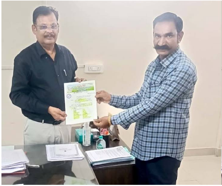
విజయవాడ ఏప్రిల్ 7 (క్రైమ్ కౌంటర్): రాష్ట్రవ్యాప్తంగా విడుదలైన దివ్యాంగుల