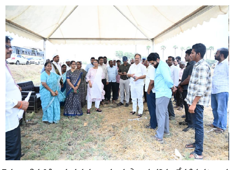
రైతుల అభివృద్ధికి రాష్ట్ర ప్రభుత్వం అత్యంత ప్రాధాన్యతనిస్తూ చేపట్టిన పట్టణం పాస్ పుస్తకాల పంపిణీ కార్యక్రమం రైతులకు ఎంతో ప్రయోజనకరంగా మారుతుందని, ముఖ్యమంత్రి నారా చంద్రబాబు నాయుడు చేతుల మీదుగా ఈ కార్యక్రమం జరగడం వేమూరు నియోజకవర్గ రైతులకు ప్రత్యేక గౌరవం అని తెలిపారు. అలాగే కూటమి నాయకులు, రైతు సోదరులు, తెలుగుదేశం పార్టీ శ్రేణులు, అభిమానులు మరియు ప్రజలు పెద్ద సంఖ్యలో హాజరై కార్యక్రమాన్ని విజయవంతం చేయాలని ఆయన పిలుపునిచ్చారు. సభకు రానున్న ప్రజలకు రాకపోకల్లో ఎలాంటి ఇబ్బందులు లేకుండా అమర్చాలూ, చెరుకుపల్లి, ఐలవరం, చుండూరు, వేమూరు, కొల్లూరు ప్రాంతాల నుండి ప్రత్యేక మార్గాలు మరియు పార్కింగ్ ఏర్పాట్లు సిద్ధం చేసినట్లు అధికారులు ఎమ్మెల్యే కి వివరించారు. ఈ పరిశీలన కార్యక్రమంలో రెవెన్యూ, పోలీస్, రోడ్డు భవనాలు, వ్యవసాయ శాఖల అధికారులు, స్థానిక ప్రజాప్రతినిధులు, కూటమి నాయకులు మరియు పార్టీ శ్రేణులు పాల్గొన్నారు.