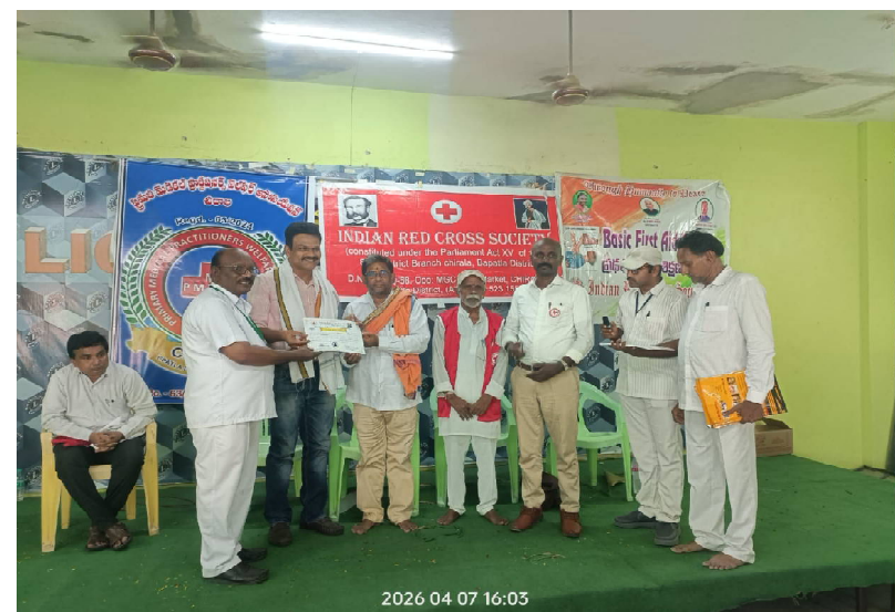
చీరాల, ఏప్రిల్ 7 (క్రైమ్ కౌంటర్): ఇండియన్ రెడ్ క్రాస్ సొసైటీ సబ్ డిస్ట్రిక్ట్ బ్రాంచ్ ఆధ్వర్యంలో మంగళవారం చీరాల లయన్స్ క్లబ్ కల్యాణ మండపంలో పి.ఎం.పి లకు ప్రథమ చికిత్స శిక్షణ కార్యక్రమం నిర్వహించారు. ప్రపంచ ఆరోగ్య దినోత్సవం సందర్భంగా చీరాల, రేపల్లె డివిజన్లకు చెందిన