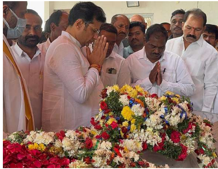
వాస్తవం : మంథని