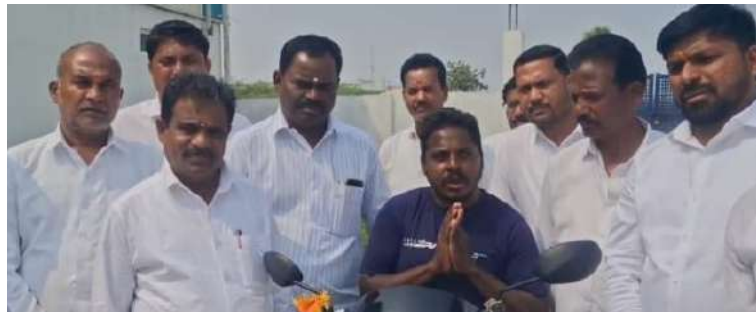
వాస్తవం : ఎల్లారెడ్డిపేట