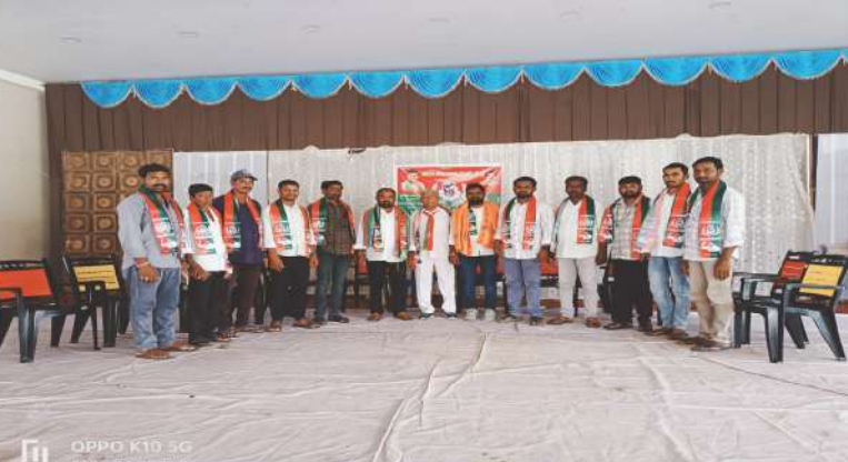
- టిఆర్పి ఆచారాలకు ఆకర్షితులై భారీగా పార్టీలో చేరిన నాయకులు, కార్యకర్తలు

నర్సింహాలపేట మండల కేంద్రంలో తెలంగాణ రాజ్యాధికార పార్టీ ఆధ్వర్యంలో నిర్వహించిన చేరికల