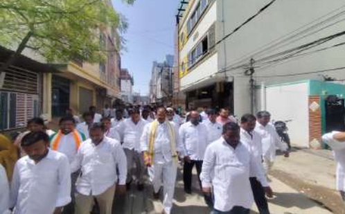
హయాల్ చాలా వరకు చెరువులు కనుమరుగయ్యాయని తిరిగి వాటిని పునరుద్ధరించేందుకు హైద్రాబాద్ కారులు నిరంతరం కృషి చేస్తున్నారన్నారు. చెరువులో గుర్రపు డెక్కను తొలగించి దోమల సమస్యకు పరిష్కారం చూపిస్తామన్నారు. బస్టిలో డ్రైనేజీ వ్యవస్థ అస్తవ్యస్తంగా ఉందని డిన్నీ త్వరలోనే పరిష్కరిస్తామన్నారు. నియోజకవర్గ అభివృద్ధి

సీఎం రేవంత్ రెడ్డి ఆధ్వర్యంలోని తెలంగాణ ప్రభుత్వం ప్రజా పాలన చేస్తుందని పేద ప్రజల పక్షాన నిలబడుతుందని టిపిసీసి ఉపాధ్యక్షుడు కూకట్పల్లి కాంగ్రెస్ పార్టీ ఇంచార్జి బండి రమేష్ పేర్కొన్నారు. బుధవారం ఆయన స్థానిక నాయకులతో కలిసి అల్లూర్ డివిజన్ రాజీవ్ గాంధీ నగర్ లో స్థానిక సమస్యలపై పాదయాత్ర నిర్వహించారు. ఈ సందర్భంగా బస్టి ఎదుర్కొంటున్న ప్రధాన సమస్యలను ప్రజలు రమేష్ దృష్టికి తీసుకువచ్చారు. మైనమ్మ చెరువు పరిసర ప్రభుత్వాలను ఆయన పరిశీలించారు. మైనమ్మ చెరువు పూడ్చి కట్టా చేయడంపై ఆయన ఆగ్రహం వ్యక్తం చేశారు. చెరువు పూడ్చివేతకు కారకమైన వారితోనే తిరిగి అక్కడ పోసిన మట్టిని తరలింపేలా అధికారులతో మాట్లాడి చర్యలు తీసుకుంటామని హెచ్చరించారు. గత పాలకుల