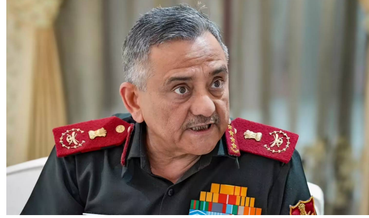
హైదరాబాద్, వేద న్యూస్:

మాటలతో యుద్ధాలు గెలువలేమని, స్పష్టమైన చర్యలు, క్రమశిక్షణ, వేగవంతమైన నిర్ణయాల ద్వారానే విజయాల సాధ్యమవుతాయని చీఫ్ ఆఫ్ డిఫెన్స్ స్టాఫ్ జనరల్ అనిల్ చౌహాన్ స్పష్టం చేశారు. శనివారం హైదరాబాద్లోని దుండిగల్ ఎయిర్ ఫోర్స్ ఆకాడమీలో నిర్వహించిన కంట్రైన్ గ్రాడ్యుయేషన్ పరేడ్లో పాల్గొన్న సందర్భంగా ఆయన ఈ వ్యాఖ్యలు చేశారు. ఈ సందర్భంగా పాకిస్థాన్ వైఖరిపై తీవ్ర విమర్శలు గుప్పించారు. ఆపరేషన్ సింధూర్ సమయంలో పాకిస్థాన్ భారీ నష్టం వాటిల్లినప్పటి