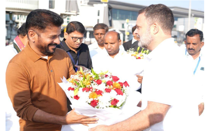
వేద న్యూస్, హైదరాబాద్ ప్రతినిధి :

లోకసభ ప్రతిపక్ష నేత రాహుల్ గాంధీ శనివారం హైదరాబాద్ కు చేరుకున్నారు. ఈ సందర్భంగా శంషాబాద్ రాజీవ్ గాంధీ అంతర్జాతీయ విమానాశ్రయంలో ముఖ్యమంత్రి ఎ. రేవంత్ రెడ్డి ఆయనకు స్వాగతం పలికారు. రాహుల్ గాంధీ రాష్ట్ర వర్కటనకు రావడంతో రాజకీయ వర్గాల్లో ఆసక్తి