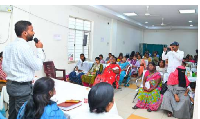
వేద న్యూస్ జగిత్యాల :

ప్రజాపాలన ప్రగతి ప్రణాళిక 99 రోజుల కార్యాచరణలో భాగంగా జగిత్యాల జిల్లాలో గర్భిణీ స్త్రీలకు ప్రత్యేక అవగాహన కార్యక్రమం నిర్వహించారు. వైద్య ఆరోగ్య శాఖ అధ్యక్షులలో జరిగిన ఈ కార్యక్రమంలో గర్భిణీలు అనుసరించాల్సిన ఆరోగ్య జాగ్రత్తలు, పోషకాహారం, నియమిత వైద్య పరీక్షలు, ప్రసవానికి ముందస్తు ఏర్పాట్లపై వైద్యులు సమగ్రంగా వివరించారు. గర్భధారణ సమయంలో తల్లి మరియు శిశువు ఆరోగ్య పరిరక్షణకు ప్రభుత్వ ఆసుపత్రిలో అందుబాటులో ఉన్న సేవలను తప్పనిసరిగా వినియోగించుకోవాలని వైద్యులు సూచించారు. సాధ్యమైనంత తవరకు సాధారణ ప్రసవాలకు ప్రాధాన్యత ఇవ్వాలని, వైద్యుల సూచనలు పాటించడం ద్వారా ఆరోగ్య సమస్యలను నివారించవచ్చని వివరించారు. ఈ