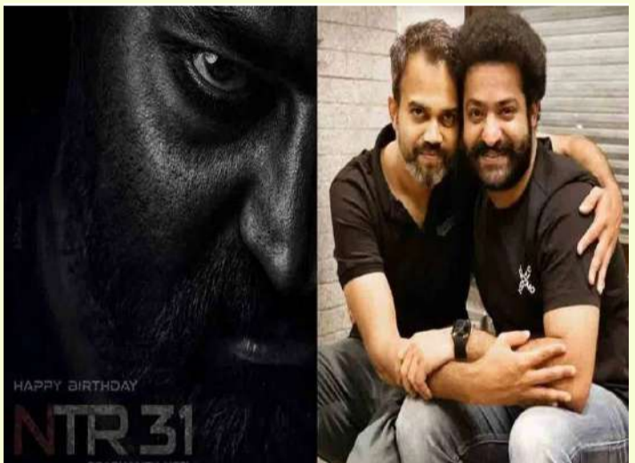
వేద న్యూస్ డెస్క్: