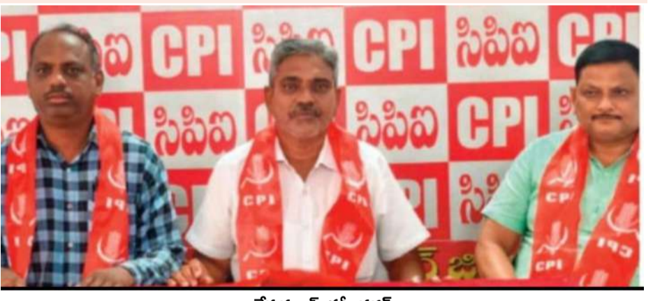
వేద న్యూస్, కరీంనగర్: