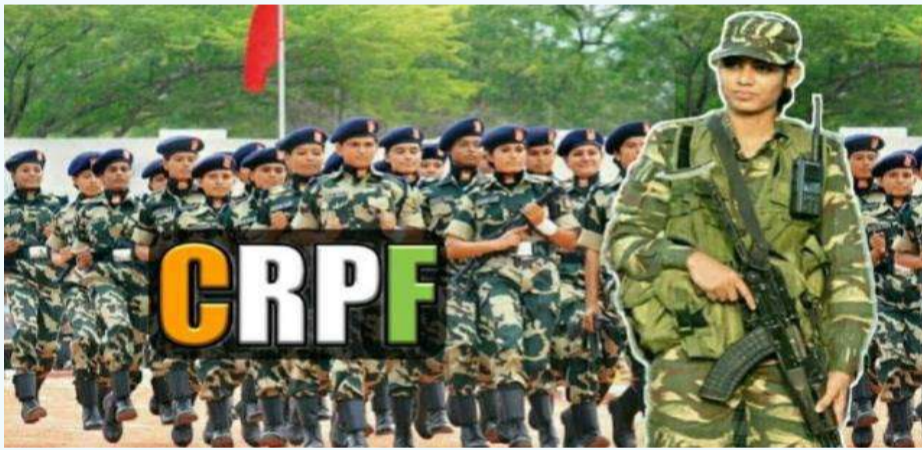
వేద న్యూస్ దెన్కొ :

భారతదేశ అంతర్గత భద్రతలో కీలక పాత్ర పోషిస్తున్న కేంద్ర రిజర్వ్ పోలీస్ బలగాల (జవాన్) పరాక్రమానికి ప్రతీకగా రేపు 'శౌర్య దివస్'ను దేశవ్యాప్తంగా ఘనంగా నిర్వహిస్తారు. 1965 ఏప్రిల్ 9వ తేదీన గుజరాత్ లోని కవ్ ప్రాంతంలో ఉన్న సర్దార్ పోస్ట్ వద్ద జరిగిన అసాధారణ పోరాటాన్ని స్ఫూరించుకుంటూ ఈ దినోత్సవాన్ని జరుపుకోవడం ఆనవాలుగా వస్తోంది. కేవలం రెండు కంపెనీల సి.ఆర్.పి.ఎఫ్ జవాన్లు, సంఖ్యాపరంగా తమకంటే ఎంతో ఎక్కువగా ఉన్న పాకిస్థాన్ పదాధిపతి ట్రోప్ లను ఎదుర్కొని నిలబడటం సైనిక చరిత్రలోనే ఒక అద్భుత ఘట్టంగా నిలిచిపోయింది. ఈ రోజు మన జవాన్ల గుండె నిబ్బరాలిని మరెవరి దేశం పట్ల వారికీ ఉన్న అంకితభావాన్ని చాటిచెబుతుంది. ఈ పోరాట నేపథ్యాన్ని పరిశీలిస్తే, 1965 ఏప్రిల్ 9 తెల్లవారజామున పాకిస్థాన్ సైన్యం 'అపరేషన్ డెస్ట్ హాక్' పేరుతో భారత భూభాగంలోకి చొరబడటానికి ప్రయత్నించింది. అత్యాధునిక ఆయుధాలతో వచ్చిన శత్రువులను చూసి బెదరకుండా, మన జవాన్లు తమ వద్ద ఉన్న పరిమిత వనరులతో సుమారు 12 గంటల పాటు వీరోచితంగా పోరాడారు. ఈ ధీకర యుద్ధంలో పాకిస్థాన్ సైన్యానికి భారీ నష్టం వాటిల్లింది, వారిలో 34 మంది సైనికులు మరణించగా, మరో నలుగురు ప్రాణాలతో పట్టుబడ్డారు.