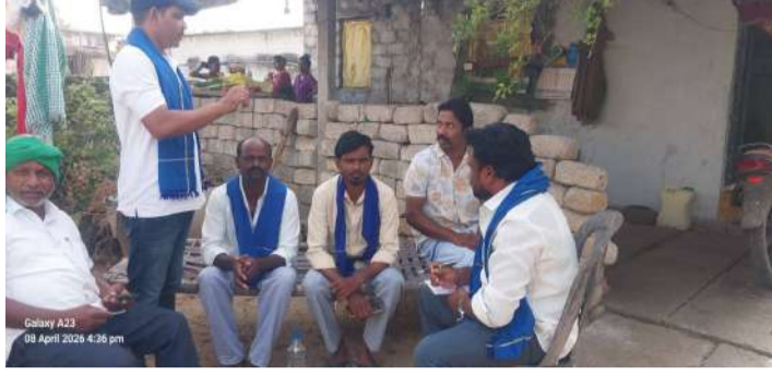
వేద న్యూస్, శాయంపేట:

హనుమకొండ జిల్లా శాయంపేట మండలం ప్రగతి సింగారం గ్రామంలో ఒకే కులానికి చెందిన కుటుంబాన్ని బహిష్కరించడం సిగ్గుచేటు చర్య అని దళిత బహుజన సంఘాలు, అంబేద్కర్ ఉత్సవ కమిటీ ఖండించాయి. కుల బహిష్కరణకు గురైన మనకి లక్షిపతి కుటుంబాన్ని నాయకులు పరామర్శించి