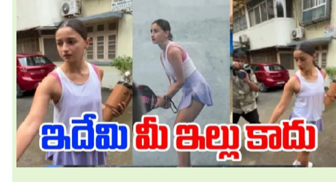
ఇదేమీ ఇల్లు కాదు

స్టార్స్ అంటే అందరికీ ఇష్టమే. వారు ఏం చేస్తున్నారు.. ? ఇక్కడో ఎలా ఉంటారు.. ? వాళ్ల విల్లులు ఎవరు.. ? ఇలాంటివన్నీ తెలుసుకోవాలని కుతూహలం ఉంటుంది. ప్రజలకు ఇలాంటి అప్డేట్స్ ఇవ్వడానికి ఫోటోగ్రాఫర్లు వారివెంట పడుతూనే ఉంటారు. లైక్స్, షేర్స్ కోసం ఎలాంటి పని అయినా చేయడానికి ఫోటోగ్రాఫర్లు సిద్ధమవుతున్నారు. అయితే స్టార్స్ కూడా మనుషులే. వారికి కూడా పర్సనల్ లైఫ్ ఉంటుంది. వారు కూడా ఆ ప్రైవేట్ లైఫ్ ను ఎంజాయ్ చేయాలనే చూస్తూ ఉంటారు. ఇలా కెమెరామ్యాన్స్ వలన అలాంటి లైఫ్