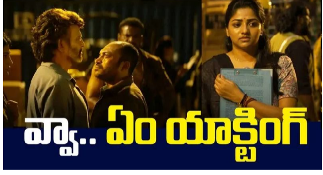
వ్యా.. ఏం యాక్టింగ్

సాధారణంగా ఒక సినిమా హిట్ అయ్యింది అంటే అందరూ హీరో హీరోయిన్లకు పేరొస్తుంది. లేకపోతే డైరెక్టర్ కు పేరొస్తుంది. అయితే చాలా రేర్ గా హీరోను కూడా డామినేట్ చేసే రోల్స్ కొంతమందికి పడతాయి. వాటివలనే వారు కెరీర్ లో స్టార్ డమ్ ను అందుకుంటారు. అలా కూలీ సినిమాలో ఇద్దరు స్టార్స్.. హీరోను మించి అదరగొట్టేశారు. వారెవరు.. ? ఎందుకు వారికి అంత పేరు వచ్చింది అనేది చూద్దాం. సూపర్ స్టార్ రజనీకాంత్ హీరోగా లోకేష్ కనగరాజ్ దర్శకత్వంలో తెరకెక్కిన చిత్రం కూలీ. సన్ పిక్చర్స్ ప్రతిష్టాత్మకంగా నిర్మించిన ఈ సినిమా ఎన్నో అంచనాల నడుమ ఆగస్టు 14 న రిలీజ్ అయ్యి మిక్స్ టాక్ ను అందుకుంది లోకేష్.. ఇప్పటివరకు కోలీవుడ్ లో పరాజయం ఎరుగని దర్శకుడుగా ఎదిగాడు. కమల్ హాసన్ కు విక్రమ్ లాంటి సినిమా ఇచ్చి ఆయన కెరీర్ లో సెన్సేషన్ హిట్ ను అందించాడు. ఇక దీంతో పాటు %బూబ్ల% అని స్టార్ట్ చేసి.. ఒక సినిమాతో ఇంకో సినిమాను లింక్ చేసి మరొక హైప్ క్రియేట్ చేశాడు. దీంతో లోకేష్ నుంచి ఒక సినిమా వస్తుంది