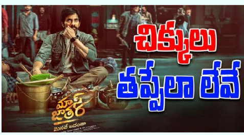
ఇప్పటివరకు ఈ సినిమా ప్రమోషన్స్ మొదలుపెట్టింది లేదు. మొదటి నుంచి ఈ సినిమా వాయిదా పడుతుందని వార్తలు వస్తున్నాయి. %ఇక మొదట్లో మాస్ జాతర రిలీజ్ డేట్ ను ఇంకా

మాస్ మహారాజా రవితేజ , శ్రీలీల జంటగా భాను భోగవరపు దర్శకత్వంలో తెరకెక్కిన చిత్రం మాస్ జాతర (సితార ఎంటర్ టైన్మెంట్స్ బ్యానర్ పై సూర్యదేవర నాగవంశీ ఈ సినిమాను నిర్మిస్తున్నాడు. ఇప్పటికే ఈ చిత్రం నుంచి రిలీజైన పోస్టర్స్, టీజర్, సాంగ్స్ ప్రేక్షకులను విశేషంగా ఆకట్టుకున్నాయి. ఇక ఈ సినిమా ఆగస్టు 27 న రిలీజ్ కు రెడీ అవుతోంది. సినిమా రిలీజ్ కు పట్టుమని పది రోజులు కూడా లేదు..