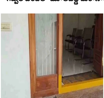
గజ్వేల్, ఏప్రిల్ 6 (తెలుగు రేఖ):