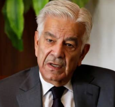
ఇస్లామాబాద్, ఏప్రిల్ 3 (తెలుగు రేఖ):

పాకిస్తాన్ రక్షణ మంత్రి ఖవాజా ఆనిస్ మరోసారి భారత్ పై అక్రమ వ్యూహాన్ని పూర్తిగా దాడి జరిగి ఏడాది కావచ్చున్న నేపథ్యంలో భారత్ తమపై బెదిరింపులకు పాల్పడుతోందని ఆరోపించారు. ఇవన్నీ చూస్తుంటే వారు తమపై దాడులకు ప్రణాళికలు రచిస్తూ.. రెచ్చగొట్టడానికి ప్రయత్నిస్తున్నట్లు అనిపిస్తోందన్నారు. మరోసారి తమతో ఘర్షణకు దిగితే తీవ్ర పరిణామాలు ఎదురొస్తాయని ఉంటుందని హెచ్చరించారు. తమపై జరిగే దాడులను వేగవంతమైన, ప్రణాళికాబద్ధమైన ప్రతిస్పందనతో విద్యుత్ కారణమన్నారు. ఇలాంటి యుద్ధాన్ని అవకాశంగా తీసుకొని పొరుగుదేశం ఏర్పాటు చేసే పాల్పడే ప్రతిస్పందన తీవ్రంగా ఉంటుందని ఇటీవల కేంద్ర రక్షణ మంత్రి రాజీవ్ గాంధీ పాకీస్ హెచ్చరించారు. ఉరి సెక్టార్ దాడి తర్వాత జరిపిన సర్టికల్ స్ట్రైక్స్, పుల్వామా తర్వాత వైమానిక దాడులు, పూర్వం దాడుల అనంతరం ఆవరేషన్ సిందూరాలను గుర్తు చేశారు. ఈ నేపథ్యంలో ఖవాజా ఆనిస్ ఈ వ్యాఖ్యలు చేయడం గమనార్హం.