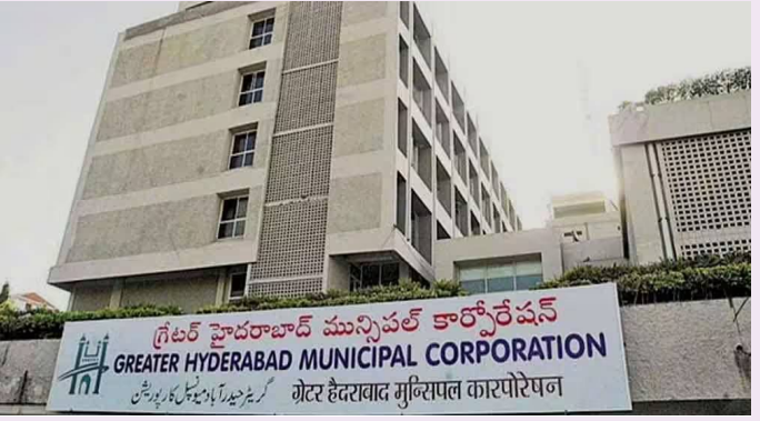
హైదరాబాద్, ఏప్రిల్ 3 (తెలుగు రేఖ):

- నిర్మాణ అనుమతులతో రూ.1,172.08 కోట్ల రాబడి