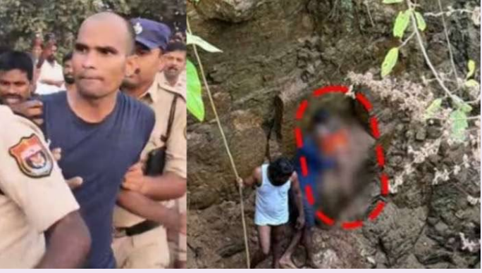
కరీంనగర్, ఏప్రిల్ 3 (తెలుగు రేఖ):