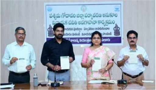
ప్యాన్లర్ ఆఫ్ ప్యానిస్ విగ్రహాల నిర్మాణానికి ముందస్తు సమావేశం ఏర్పాటు...