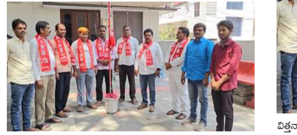
తగినంత నష్టపరిహారం చెల్లించకుండా, రైతులకు భయభ్రాంతులకు గురిచేస్తూ అధికారులు భూములు తీసుకోవడం తగదని, వారు హెచ్చరించారు. ఇప్పటికైనా ప్రభుత్వం స్వీకరిస్తున్న భూములకు ఇప్పుడున్న మార్కెట్ విలువ ప్రకారం మూడింతలు నష్టపరిహారం చెల్లించాలని వారు డిమాండ్ చేశారు. పట్టా పాస్ బుక్ లోని పేద రైతులందరికీ వెంటనే పాస్పుక్కులు మంజూరు చేయాలని. సబ్సిడీ