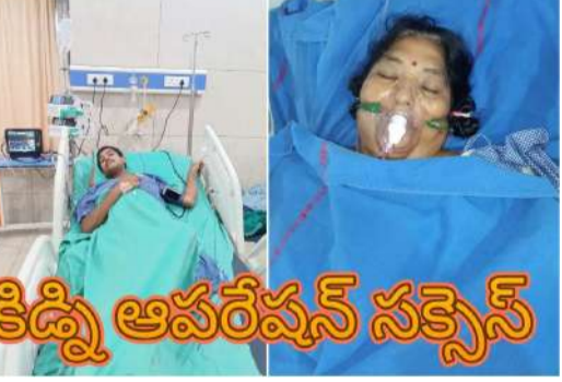
కిడ్నీ ఆపరేషన్ సక్సెస్ ఆయన చూపిన ఈ చొరవ నిరుపేదలకు కొండత ధైర్యాన్ని ఇస్తోంది.