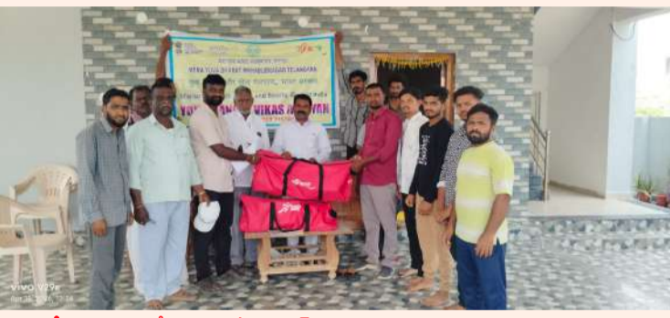
విజేత నారాయణపేట జిల్లా / ఉట్యూర్ : ఉట్యూర్ మండల కేంద్రంలో మేరా యువభారత్ ఆధ్వర్యంలో యువ మండల్ వికాస్ అభియాన్ కార్యక్రమం విజయవంతంగా నిర్వహించబడింది. ఈ