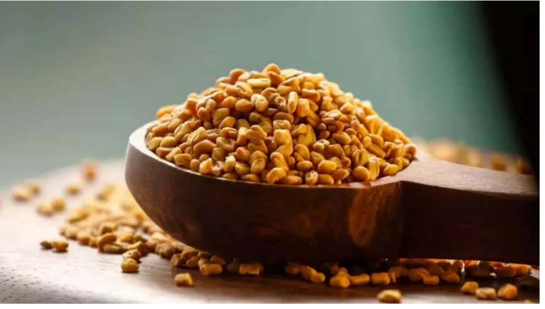
ఉదయం ఖాళీ కడుపుతో వాడిని తింటే అద్భుతమైన ప్రయోజనాలు ఉంటాయంటున్నారు.

జీర్ణక్రియ: మెంతి గింజల్లో అధికంగా ఉండే ఫైబర్ జీర్ణక్రియను మెరుగుపరుస్తుంది. అలాగే కడుపులో చికాకు, మలబద్ధకం తదితర సమస్యల నుంచి ఉపశమనం కలుగుతుంది. అందుకే మెంతిగింజలు తీసుకోవడం వల్ల మంచి ప్రయోజనం లభిస్తుంది. ఒక టేబుల్ స్పూన్ మెంతులు గింజలను రాత్రంతా నీటిలో నానబెట్టి, మరుసటి రోజు