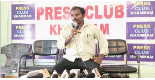
సరిహద్దు రైతులు, పెద్దమనుషులు దొర్లస్యం.

పంచాయతీకి అని పిలిచి దాడి చేశారు: బాధితుడు