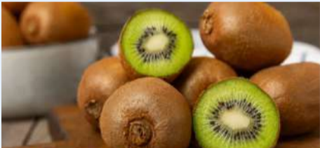
30 డెస్ కివి చాలెంజ్.. మీ శరీరంలో జరిగే అద్భుతాలివే..

కివి పండు చిన్నగా, చూడటానికి ఆకర్షణీయంగా కనిపించినా, ఇది ఆరోగ్య ప్రయోజనాల పవర్ హౌస్ గా చెప్పవచ్చు. ఇందులో విటమిన్ సి, ఫైబర్ శక్తివంతమైన యాంటీఆక్సిడెంట్లు పుష్కలంగా ఉన్నాయి. ఇది కేవలం రుచికి మాత్రమే కాదు, మన శరీరంలోని ప్రతి భాగానికి మేలు చేస్తుంది.