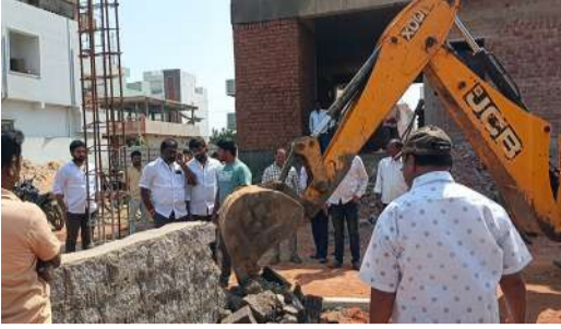
నూతన గృహాలకు అనుమతులు తప్పనిసరి సెట్ బ్యాక్ వదిలి నిర్మాణాలు చేపట్టాలి లేకపోతే కఠిన చర్యలు