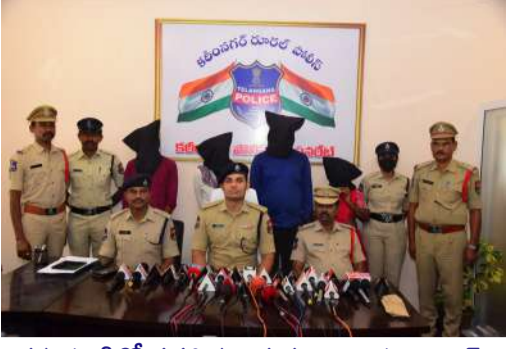
కన్నతండ్రితో సహా నలుగురు నిందితుల అరెస్టు

విజేత, కరీంనగర్ (ఐ.ఎం) : సొంత బిడ్డలనే కాలుముడిలా మారి బావిలో ముంచి చంపిన దారుణ ఘటనలో కన్నతండ్రితో పాటు ఆతనికి సహకరించిన కుటుంబ సభ్యులను కరీంనగర్ రూరల్ పోలీసులు అరెస్టు చేశారు. ఆస్తిపై మక్కువతో ఆడపిల్లలనే వివక్షతో ఈ దారుణానికి ఒడిగట్టినట్లు విచారణలో వెల్లడైంది. కరీంనగర్ రూరల్ మండలం జూజ్లినగర్ నివాసి కన్నతండ్రి (28), ప్రతిమ మెడికల్ కాలేజీలో కంప్యూటర్ ఆపరేటర్గా పనిచేస్తున్నారు. 2020లో