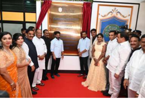
విఎన్ లెక్ ఫీల్డ్ సూట్ ను ప్రారంభించిన సీఎం రేవంత్ రెడ్డి