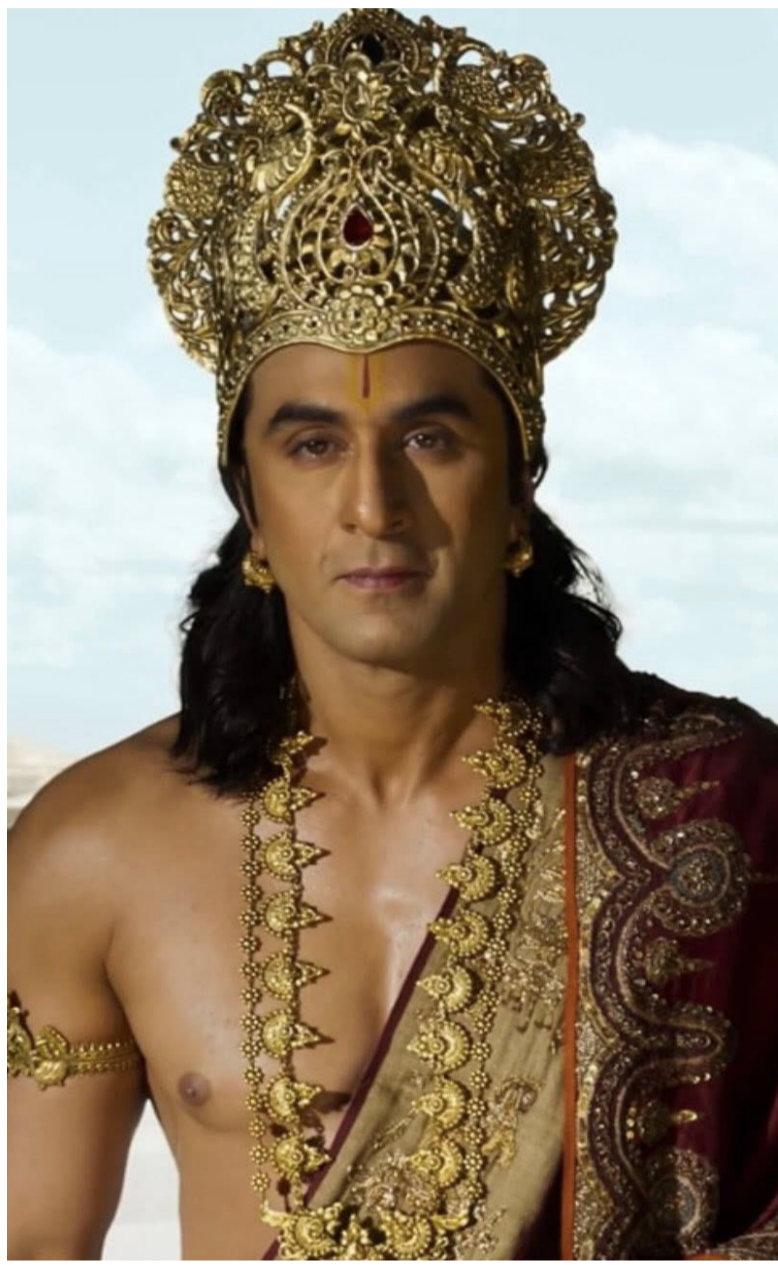
అద్భుతంగా వెండితెరపై ఆవిష్కరించేందుకే మేకప్ షూన్ చేస్తున్నారని రణబీర్ తెలిపాడు.