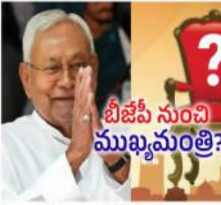
బీజేపీ నుంచి ముఖ్యమంత్రి?

మొదటి వేజి తరువాతు అయితే, బీహార్ లో ఎన్డీయే కూటమి అధికారంలో ఉన్న కాలంగా బీజేపీ నుంచి ముఖ్యమంత్రి స్థానం దక్కించుకునే అవకాశం ఉన్నట్లు సమాచారం. ఈ మేరకు జాతీయ మీడియాలో ఇద్దరి పేర్లు చక్కర్లు కొడుతున్నాయి. బీహార్ కొత్త సీఎం సామ్రాట్ చౌదరి బాధ్యతలు చేపట్టవచ్చని తెలుస్తోంది. అలాగే, నిత్యానంద రాయ్ పేరు కూడా ప్రముఖంగా వినిపిస్తోంది. కాగా, అధికారికంగా ప్రకటన రావాల్సి ఉంది. ఇక, సామ్రాట్ చౌదరి బీహార్ రాజకీయాల్లో అంతర్భాగంగా ఉన్నారు. పంచాయతీరాజ్ మంత్రిగా ఉన్నప్పటి నుంచి ప్రస్తుతం రాష్ట్ర హోంమంత్రిగా బాధ్యతలు నిర్వహిస్తున్న వరకు బీజేపీ నాయకుడిగా కీలక పదవులను నిర్వహించారు. ప్రస్తుతం ఉప ముఖ్యమంత్రిగా రెండవసారి బాధ్యతలు నిర్వహిస్తున్నారు. సీఎం రేసు కోసం నిత్యానంద రాయ్ కూడా పోటీలో ఉన్నారు. రాయ్ ప్రస్తుతం హోంమంత్రిగా పనిచేస్తున్నారు. కేంద్రంలో పని చేయడానికి ముందు, రాయ్ బీహార్ కు బీజేపీ అధ్యక్షుడిగా పనిచేశారు. రాయ్ హాజీపూర్ నుండి నాలుగుసార్లు ఎమ్మెల్యేగా ఉన్నారు. 2015లో రాయ్ పార్లమెంటులో రెండో గెలుపుకు సుదీర్ఘ కాలం తరువాత సీఎం రేసులో చేరినాడు. మరోవైపు, నితిష్ కుమారుడు సీఎం రేసులో బీహార్ సీఎం అయ్యే అవకాశం ఉందని తెలుస్తోంది.