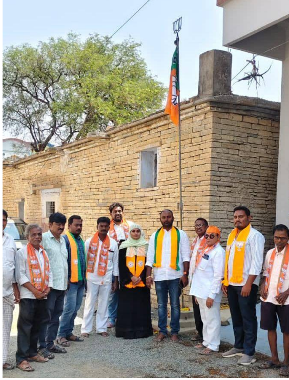
చేయాలని కోరారు. ఈ కార్యక్రమంలో పాల్గొన్న పాండురంగ స్వామి దేవాలయం ధర్మకర్త మరియు వారి కమిటీకి, భారతీయ జనతా పార్టీ కార్యకర్తలకు ప్రత్యేక ధన్యవాదాలు తెలిపారు.

అటల్ బిహారీ, ఎల్వే అడ్వానీ వీళ్ళందరూ పార్టీకి మూల స్తంభాలు. ఇప్పుడు మంత్రి సరేంద్ర మోడీ నాయకత్వంలో వికసిత భారత్ లక్ష్యంగా మన దేశం ఒక శక్తిమంతా దేశంగా ఎదుగుతుంది కావున కార్యకర్తలు, బూత్ స్థాయి మరియు గ్రామ స్థాయిలో పార్టీని మరింత బలపర్చే విధంగా కృషి చేయాలి అని తెలిపారు. ప్రతి కార్యకర్తకు కేంద్ర ప్రభుత్వ పథకాల గురించి పూర్తిగా అవగాహన ఉండాలని, వాటిని ప్రజలకు చేరవేయాలని సూచించారు. అలాగే, రాబోయే పాండురంగ స్వామి బ్రహ్మోత్సవాల ఏర్పాట్ల గురించి చర్చించి, ప్రతి కార్యకర్త ఆ కార్యక్రమాలలో చురుకుగా పాల్గొని సేవ