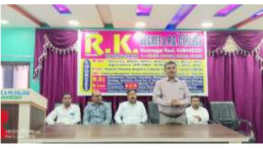
ప్రతిష్టాత్మకంగా నిర్వహిస్తున్నటువంటి విక్సిట్ భారత్ యూత్ పార్లమెంట్ జిల్లా స్థాయి ఉపన్యాస పోటీలలో మై భారత్ పార్లమెంట్ రిజిస్ట్రేషన్ చేసుకున్న 18 సంవత్సరాల నుంచి 25 సంవత్సరాల మధ్య ఉన్నటువంటి విద్యార్థులందరూ ఉదయం 10.00 గంటలకు హాజరవ్వాలని, ఎవరైతే ఈ జిల్లా స్థాయిలో ఉత్తమ ప్రతిభ తో విజేతలుగా నిలుస్తారో వారిలో 5గురు రాష్ట్ర స్థాయికి ఎంపిక అవుతారని, ఇలాంటి కార్యక్రమాలలో యువత ఎల్లప్పుడూ ముందుదాని పేర్కొన్నారు.