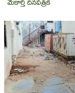
జనరేటర్ మరియు ఎయిర్ కూలర్లు ఏర్పాటు చేయడంతో ఆ దారిలో రాకపోకలు పూర్తిగా నిలిచిపోయాయి. ఈ తరుణంలో స్థానికులు తీవ్ర ఇబ్బందులకు గురవుతున్నారు. ఇట్టి విషయంపై మున్సిపల్ అధికారులు మున్సిపల్ అధికారులు వెంటనే స్పందించి రాడ్డు అక్రమణకు పాల్పడిన వారిపై చర్య తీసుకొని జనరేటర్ మరియు ఎయిర్ కూలర్లు తొలగించి రాడ్డును వినియోగంలోకి తీసుకురావాలని ఆ కాలనీవాసులు కోరుతున్నారు. ఈ కార్యక్రమంలో కాలనీవాసులు, యువకులు తదితరులు పాల్గొన్నారు.

- మున్సిపల్ అధికారులు వెంటనే స్పందించి చర్య తీసుకోవాలని విన్నపం