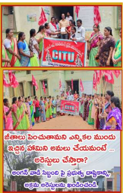
జిల్లాలు పెంచుతామని ఎన్నికల ముందు ఇచ్చిన హామీని అమలు చేయమంటే... అరెస్టులు చేస్తామంటే... అంగన్ వాడీ సిబ్బంది పై ప్రభుత్వ దాడికాన్ని, అక్రమ అరెస్టులను ఖండించండి.