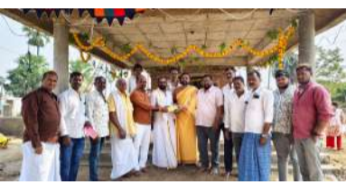
అలయ చైర్మన్, శాశ్వత పురోహితులు దూపం మఠం రాజుకు ఆదివారం అందజేశారు. ఈ సందర్భంగా ఆలయ చైర్మన్ దూపం మఠం రాజు మాట్లాడుతూ, శివుడు-ఆంజనేయ స్వామి ఒకే గర్భగుడిలో ప్రతిష్ఠించబడిన ఆలయాల అరుదుగా కనిపిస్తాయని పేర్కొన్నారు. కాకతీయుల పాలన కాలంలో పాలరాతి శివలింగంతో పాటు హనుమాన్ విగ్రహాన్ని పడమర ముఖ ద్వారంతో నిర్మించారని వివరించారు. ఈ ఆలయానికి చారిత్రక ప్రాధాన్యం

- శిథిలావస్థలోని పురాతన శివ ఆంజనేయ ఆలయానికి గ్రామస్థుల ముందడుగు