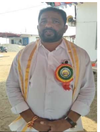
కలగాలని ఆయన ఆకాంక్షించారు. ధర్మం, న్యాయం, సత్య మార్గంలో నడవాలని ఈ పర్వదినం మనకు

- శ్రీ మెట్టు రామలింగేశ్వర స్వామి ఆలయం చైర్మన్ పైడిపల రఘు చాంద్