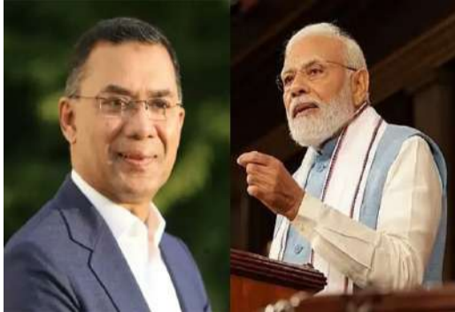
బంగ్లాదేశ్ ఎన్నికల్లో విజయం సాధించిన బంగ్లాదేశ్ నేషనలిస్టు పార్టీ (బిఎన్పీ) చైర్మన్ తారిత్రాగ్రహణ కొత్త ప్రధానిగా ప్రమాణస్వీకారం చేసేందుకు సిద్ధమయ్యారు. ఫిబ్రవరి 17న ఈ కార్యక్రమం జరగనున్నట్లు తెలుస్తోంది. ఇందులో పాల్గొనాలని భారత ప్రధాని మోదీకి ఆహ్వానం అందినట్లు సమాచారం. ఈ మేరకు అధికార పక్షాలను ఉటంకిస్తూ మీడియాలో కథనాలు వస్తున్నాయి. 2లో..