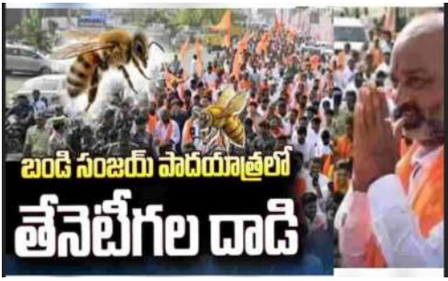
బండి సంజయ్ పాదయాత్రలో తేనెటీగల దాడి

కేంద్ర మంత్రి బండి సంజయ్ చేపట్టిన 'అంజన్ ఆశీర్వాద' పాదయాత్రలో అనుకోని సంఘటన చోటుచేసుకుంది.