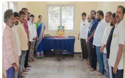
నాయకుడు కాదని, బదుగు, బలహీన వర్గాల అభ్యున్నతి కోసం, సమాజంలో సమానత్వం కోసం నిరంతరం పోరాడిన గొప్ప ఆదర్శ నేత అని కొనియాడారు. కేంద్ర మంత్రిగా, పార్లమెంట్