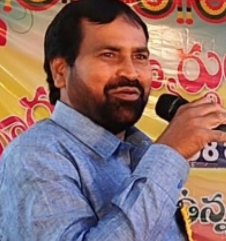
ఒక నిర్ణయాత్మక సూచనలు ఇవ్వాలని కోశారు.