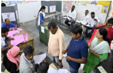
ప్రతిష్టాత్మకంగా తీసుకోవడంతో ఈ ఎన్నికపై ఆసక్తి నెలకొంది. గత అసెంబ్లీ ఎన్నికల్లో సగంరో అధికార కాంగ్రెస్ పార్టీకి అధిపతిని సీట్లు దక్కలేదంటూ.. ఈ ఉపఎన్నికలో సగంరో తన ఉనికి కాపాడుకోవాలని దృక్పథంవహిస్తోంది.. ఈ ఉపఎన్నికలో సగంరో తన ఉనికి కాపాడుకోవాలని దృక్పథం వహిస్తోంది. అయితే.. తుది జాబితా విడుదల కావడంతో త్వరలోనే ఉప ఎన్నిక జరిగే అవకాశం ఉంది.