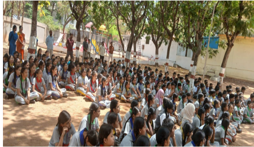
గోల్డ్ సాదించేలా రోజువారీ ప్లాన్ ఉండాలని సూచించారు. యవ్వన దశలో కలిగే ఆకర్షణలు, సోషల్ మీడియా వల్ల కలిగే