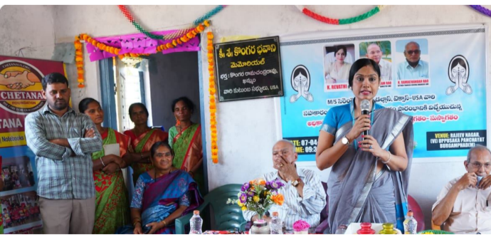
మన మహాత్మి న్యూస్ ఉప్పుసాక గ్రామపంచాయతీ రాజ్ నగర్ ఆదివాసి గ్రామంలో నూతన అంగన్వాడీ కేంద్రాన్ని ప్రారంభించారు. భవనం లేక చిన్నారలు, గర్భిణీలు, బాలింతలు ఎదుర్కొంటున్న ఇబ్బందులను