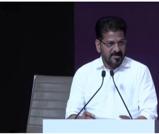
ఫాదర్ మోడీ దిల్లీలో ఉన్నారన్నారు. ఆయనే విజయన్ ను కేసుల నుంచి రక్షిస్తున్నారని రేవంత్ వివరించారు. మోడీ, విజయన్ మధ్య ఒప్పందం ఉందని అనుమానం వ్యక్తం చేశారు. కేరళంలో సక్సెస్ ఫుల్ విజయన్ పాలనలో వచ్చింది కాదని ఉమెన్ చాంది, కరుణాకర్ కేరళం అభివృద్ధి కోసం బాటలు వేశారన్నారు. పినరయి విజయన్ కు కాలం అయిపోదని అన్నారు. తెలంగాణలో ఏ మూలకైనా వెళ్లి మేం అమలు చేస్తున్న

హైదరాబాద్ : కేరళం సీఎం పినరయి విజయన్ తన 120 నెలల పాలనలో పూర్తిగా విఫలమయ్యారని ముఖ్యమంత్రి రేవంత్ రెడ్డి విమర్శించారు. కేరళంలో సరైన అవకాశాలు లేక యువత ఉపాధి కోసం విదేశాలకు వెళ్లారని ఆరోపించారు. కేరళంలో వున్నట్లు, చిన్నపిల్లలే ఎక్కువగా కనిపిస్తున్నారని తెలిపారు. విద్యావంతులు నైపుణ్యం కలిగిన యువత విదేశాలకు వెళ్లడం సరికాదన్న ఆయన వాళ్లు తిరిగిచ్చి ఉపాధి పొందేలా చేస్తామని హామీ ఇచ్చారు. తెలంగాణ మాదిరి అభివృద్ధి, మౌలిక వసతుల కల్పన, ఉద్యోగ, ఉపాధి అవకాశాలను మెరుగుపర్చడం లాంటివి కేరళంలో అమలు చేస్తామని రేవంత్ రెడ్డి వివరించారు. తెలంగాణలో ఏ మూలకైనా వెళ్లి తాను అమలు చేస్తున్న సంక్షేమ, అభివృద్ధి కార్యక్రమాలను పరిశీలించవచ్చని పినరయి విజయన్ సహా ఎల్ డీఎఫ్ నేతలకు స్పష్టం చేశారు. ఎన్నికలు కేరళం, తెలంగాణ మధ్య తారస్థి రేవంత్ యూడీఎఫ్, ఎల్ డీఎఫ్ మధ్య జరుగుతున్నాయని తెలిపారు. పినరయి విజయన్ పని అయిపోయిందన్న రేవంత్ రెడ్డి, మూడింట రెండుంటుల మెజార్టీతో యూడీఎఫ్ గెలుస్తుందని విశ్వాసం వ్యక్తం చేశారు. ఇటీవల తనపై పినరయి చేసిన విమర్శలను రేవంత్ రెడ్డి తోసిపుచ్చారుమోదీ, విజయన్ల మధ్య ఒప్పందం ఉంది :