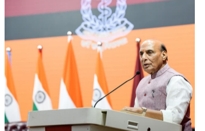
విచ్చింది. ఆ సమయంలో బంగారీదేశకు భారత సైన్యం అందగా నిలిచింది. అప్పుడే పాక్ ఎన్నో వర్తమానాలు ఎదుర్కొందని రాజ్ నాథ్ గుర్తుచేశారు. ఈ సందర్భంగా రెండు పార్లమెంటుల మధ్య ఉద్రిక్తతలను పెంచే ప్రకటనలు చేయవద్దని ఇస్లామాబాద్ కు వార్నింగ్ ఇచ్చారు. కేంద్రంపై డీఎంసీ ఫైరెంజీవైపు ఈ ఘటనపై డీఎంసీ కూడా కేంద్ర ప్రభుత్వంపై విమర్శలు చేసింది. కోల్కతాపై దాడి చేస్తామని పాకిస్తాన్ రక్షణ మంత్రి ఖవాజా అసీఫ్ బహిరంగంగా బెదిరించడాన్ని ఖండించే ధైర్యం తెదని ఆరోపించింది.

కోల్కతా: కోల్కతాపై దాడి చేస్తుంటూ వివాదాస్పద వ్యాఖ్యలు చేసిన పాకిస్తాన్ రక్షణ మంత్రి ఖవాజా అసీఫ్? కు రక్షణ మంత్రి రాజ్ నాథ్ సింగ్ స్ట్రాంగ్ కౌంటర్ ఇచ్చారు. పాకిస్తాన్ రెండు భాగాలుగా విడిపోయినప్పుడు వారు వర్తమానాలను అనుభవించారని ఎద్దేవా చేశారు. కాబట్టి ఆయన అలాంటి రెచ్చగొట్టే ప్రకటనలు చేయకూడదని సూచించారు. వారు బంగారీపై కన్నెస్తే పాకిస్తాన్ ఎన్ని భాగాలుగా విడిపోతుందో ఆ దేవుడికే తెలుసని వ్యాఖ్యానించారు. “పాకిస్తాన్ రక్షణ మంత్రి అలాంటి రెచ్చగొట్టే ప్రకటన చేసి ఉండకూడదు. 55 ఏళ్ల క్రితం పాకిస్తాన్ రెండు భాగాలుగా విడిపోయినప్పుడు వారు దాని వర్తమానాలను అనుభవించారు. వారు ఇప్పుడు బంగారీపై కన్నెస్తే, ఈసారి పాకిస్తాన్ ఎన్ని భాగాలుగా విడిపోతుందో దేవుడికే తెలియాలి.” ఈ క్రమంలోనే 55 ఏళ్ల క్రితం పాకిస్తాన్ రెండుగా విడిపోయిన విషయాన్ని రాజ్ నాథ్ ప్రస్తావించారు. 1971లో జరిగిన యుద్ధంలో తూర్పు పాకిస్తాన్ నుంచి విడిపోయి బంగారీదేశ స్వతంత్ర దేశంగా