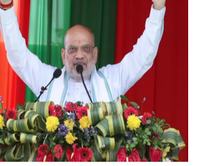
అగ్రహారంపై వైపు కాంగ్రెస్ అధ్యక్షుడు మల్లికార్జున్ ఖర్గే ఇటీవల గుజరాత్? ను నిరక్షరాస్యుల ప్రాంతంగా అభివర్ణించడాన్ని అమిత్ షా తీవ్రంగా ఖండించారు. “దయానంద సరస్వతి, మహాత్మా గాంధీ, సర్దార్ వల్లభ్ బాబు వలే, విక్రమ్ సారాభాయ్, ప్రధాని నరేంద్ర మోడీ లాంటి మహానుభావులను అందించిన గుజరాత్ ను నిరక్షరాస్యులని పిలవడానికి మీకు ఎంత ధైర్యం ఇలా అన్నందుకు కాంగ్రెస్ నేతలు సిగ్గుపడాలి” అని అమిత్ షా అగ్రహారం వ్యక్తం చేశారు. అలాగే ‘అర్ ఎన్ ఎస్ ను, బీజేపీలను పాములు అని, వాటిని చంపాలి’ అని ఖర్గే చేసిన వ్యాఖ్యలు ప్రజాస్వామ్య విలువలకు విరుద్ధమని అన్నారు. ‘ఖర్గే, ఈ వేదికపై వచ్చి చుట్టూ చూడండి. వేలాది మంది బీజేపీ, సభ్యులు మీ ముందే ఉంటారు’ అని పేర్కొన్నాడు. మరోవైపు రాహుల్ గాంధీ కాంగ్రెస్

అసోం : ఎన్నికల ప్రచారంలో ఉన్న కేంద్ర హోంమంత్రి అమిత్ షా, కాంగ్రెస్ పై, రాహుల్ గాంధీపై విమర్శల వర్షం కురిపించారు. అసోం ను చొరబాటుదారుల ఆధిపత్య ప్రాంతంగా మారినప్పుడు ఆయన తేల్చివెప్పారు. అసోంలోని పర్వతాంధీలో నిర్వహించిన ఎన్నికల రాష్ట్రీయ్ పోస్టల్ అమిత్ షా, ప్రతిపక్షాలపై వ్యంగ్య ప్రస్తావనలు సందించారు. “రాహుల్ బాబా ఇది స్పష్టంగా విన. అసోంను చొరబాటుదారుల అడ్డంగా మారనివ్వం. ఓటు బ్యాంకు రాజకీయాల కోసం వివక్షలు ఇస్తాళ్లు చొరబాటుదారుల వల్ల ఉదాసీనంగా ఉన్నాయి. ఇప్పటికే చొరబాటుదారులను గుర్తించాం. బీజేపీ అధికారంలోకి రాగానే వారిని ఒక్కొక్కరి గా విరిపారేస్తాం. చొరబాటుదారులకు కాంగ్రెస్ రక్షణ! సీపీఎ గురించి మాట్లాడినప్పుడల్లా కాంగ్రెస్ అడ్డుకుంటోంది. కుట్రపూరితంగా ఈ ప్రాంతాన్ని చొరబాటుదారుల జోన్ గా మార్చాలని నా వారు చూశారు. 1950 నాటి వలసదారుల బహిష్కరణ చట్టాన్ని రద్దు చేసి, 1983లో ఐఎండీలో చట్టాన్ని తీసుకువచ్చారు. తద్వారా చొరబాటుదారులకు రక్షణ కల్పించారు. అసోం, బంగారీ, త్రిపురలో బీజేపీ-ఎన్ డీఎ ప్రభుత్వాలు ఉంటేనే ఈ అక్రమ చొరబాటులు పూర్తిగా అవుతాయి. తద్వారా సైనికులకు ఉద్యోగాలు, రేషన్, జీవనోపాధి కలుగుతాయి” అని అమిత్ షా అన్నారు. మల్లికార్జున్ ఖర్గే వ్యాఖ్యలపై