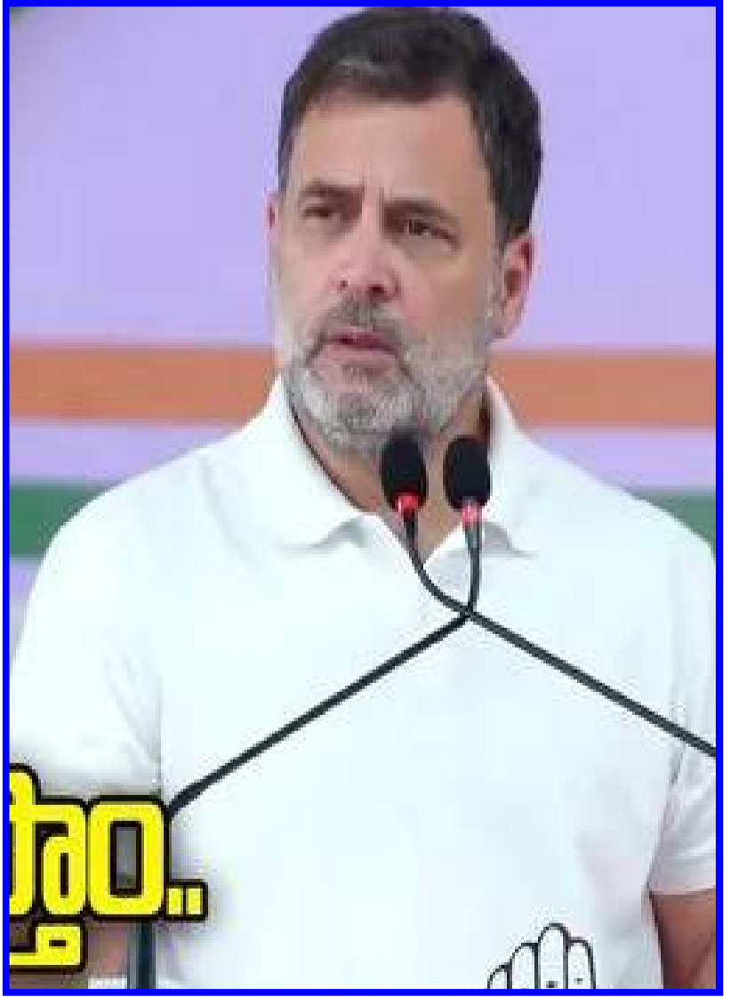
కాంగ్రెస్ ఎంపీ రాహుల్ గాంధీ

అసెంబ్లీ ఎన్నికల్లో తమ పార్టీ అధికారంలోకి వస్తే పుదుచ్చేరికి రాష్ట్ర హోదా కల్పిస్తుందని కాంగ్రెస్ ఎంపీ రాహుల్ గాంధీ హామీ ఇచ్చారు. పుదుచ్చేరిలోని ప్రాంతీయ నాయకులను బీజేపీ పక్కనపెట్టి రిమోట్ కంట్రోల్ ద్వారా పాలన 3 లో