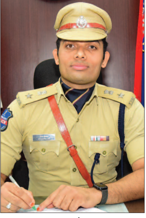
మంది నిందితులపై చర్యలు తీసుకున్నారు. జమ్మికుంట పోలీస్ స్టేషన్ పరిధిలో 15 కేసులు, 24

కరీంనగర్, ఏప్రిల్ 08: కరీంనగర్ పోలీస్ కమిషనరేట్ పరిధిలో అక్రమ ఇసుక రవాణా, నిల్వ, విక్రయాలపై పోలీసులు కఠిన చర్యలు కొనసాగిస్తున్నారు. మార్చి నెలలో నిర్వహించిన ప్రత్యేక డ్రైవ్లో భాగంగా 120 ఎఫ్ఐఆర్లు నమోదు చేసి, 139 వాహనాలను స్వాధీనం చేసుకుని, 161 మంది నిందితులపై కేసులు నమోదు చేసినట్లు పోలీస్ కమిషనర్ గౌడ్ అలం తెలిపారు. అక్రమ ఇసుక రవాణా కారణంగా ప్రభుత్వ ఆదాయానికి నష్టం కలగడమే కాకుండా, రోడ్లు భగ్గభగ్గ, పర్యావరణ సమతుల్యత, ప్రజా శాంతి భగ్గతలపై ప్రతికూల ప్రభావం పడుతున్న నేపథ్యంలో కఠిన చర్యలు చేపట్టినట్లు తెలిపారు. డివిజన్ వారీగా చర్యలు: టోన్ డివిజన్లో 15 కేసులు నమోదు చేసి, 12 వాహనాలు స్వాధీనం చేసుకుని, 15 మంది నిందితులపై చర్యలు తీసుకున్నారు. రూరల్ డివిజన్లో అత్యధికంగా 73 కేసులు నమోదు చేసి, 79 వాహనాలు స్వాధీనం చేసుకుని, 98 మంది నిందితులపై కేసులు నమోదు చేశారు. హనువాడలో డివిజన్లో 32 కేసులు నమోదు చేసి, 48 వాహనాలు స్వాధీనం చేసుకుని, 48 మంది నిందితులపై చర్యలు తీసుకున్నారు. పోలీస్ స్టేషన్ వారీగా గణాంకాలు: కరీంనగర్ రూరల్ పోలీస్ స్టేషన్ పరిధిలో అత్యధికంగా 28 కేసులు నమోదు చేసి, 36 వాహనాలు స్వాధీనం చేసుకుని, 40