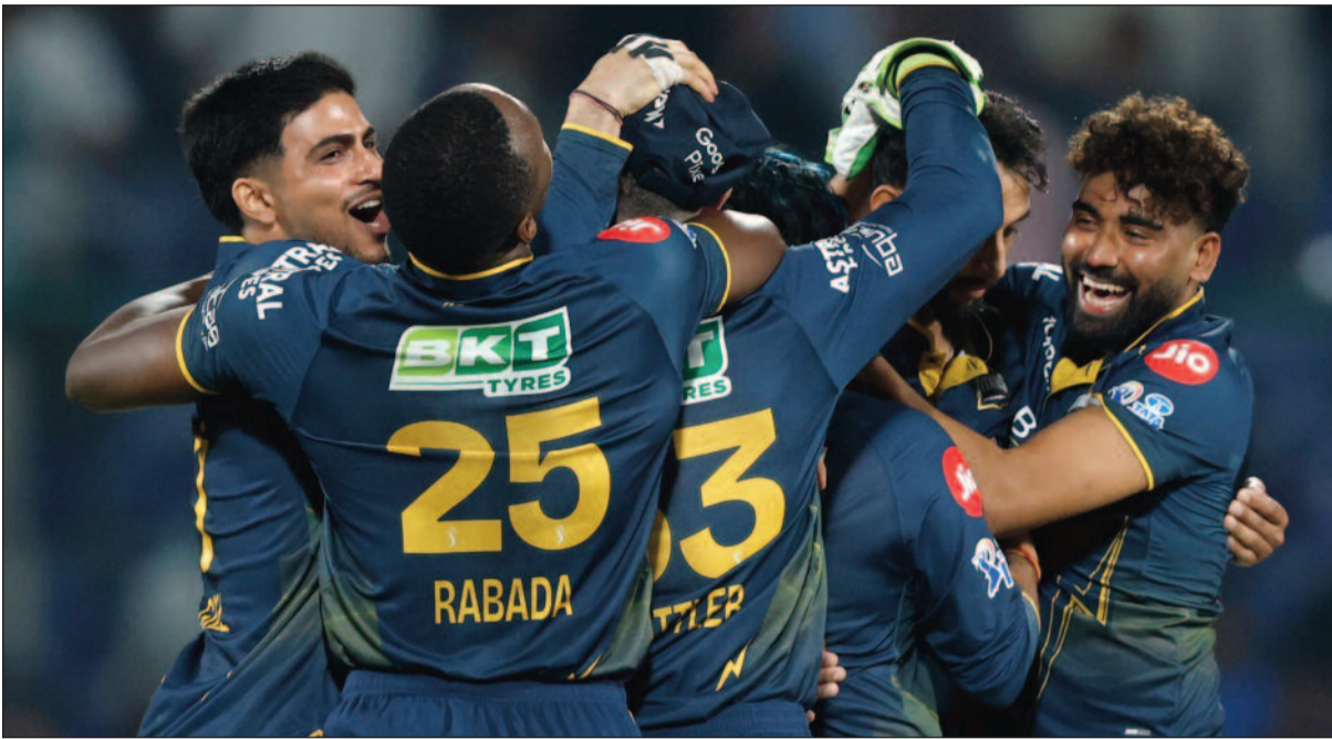
భారీ స్కోరు సాధించింది.

మూడో బంతి కువీప్ సింగిల్ తీయగా, నాలుగో బంతిని మిల్లర్ భారీ సిక్స్ తో స్టేడియం బయటికి పంపాడు. దీంతో సమీకరణం కాస్తా రెండు బంతుల్లో రెండింటికి మారింది. ఐదో బంతికి పరుగు తీయలేకపోయిన మిల్లర్.. ఆఖరి బంతిని షాట్ ఆడటంలో విఫలమై కావీప్ రనౌట్ కు కారణమయ్యాడు. కీవర్ బట్లర్ విసిరిన త్రో వికెట్ కు తాకగా, ఈ సీజన్లో గుజరాత్ తొలి విజయాన్ని ఖాతాలో వేసుకుంది. అంతకుముందు ఫస్ట్ బ్యాటింగ్ చేసిన గుజరాత్.. నిర్దిష్ట ఓవర్లకు 4 వికెట్లు మాత్రమే కోల్పోయి 210 రన్స్ చేసింది. కెప్టెన్ శుభవన్ గిల్ (45 బంతుల్లో 70, 4 ఫోర్లు, 5 సిక్స్లు), వాషింగ్టన్ సుందర్ (32 బంతుల్లో 55, 6 ఫోర్లు, 2 సిక్స్లు), జోస్ బట్లర్ (27 బంతుల్లో 52, 3 ఫోర్లు, 5 సిక్స్లు) అర్ధ శతకాలతో ఆ జట్టు