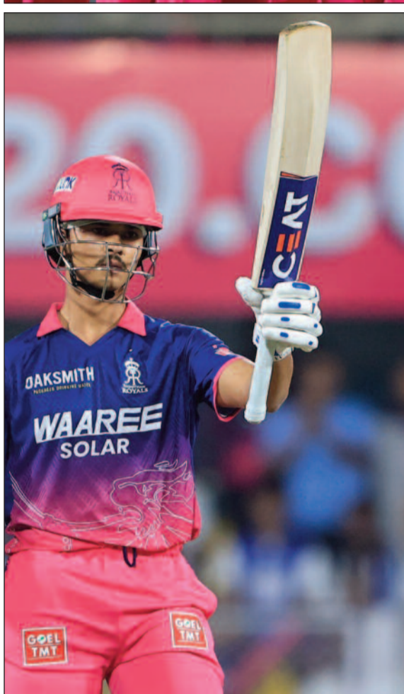
రాజస్థాన్ జైస్వాల్.. ఇన్వింగ్స్కు అదిరిపోయే ఫినిషింగ్ టచ్ ఇచ్చారు.