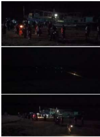
ప్రాణాలతో చెలగాటంమాడుతున్నారని స్థానికులు ఆరోపిస్తున్నారు. పోలవరం

సాయంత్రం 6గంటలలోపే బోటు నడపడం ఆపేయాలి. అత్యవసరమైతే... అంటే ప్రాణాల మీదికి వస్తే, ఏ మార్గం లేకపోతే ..అదీ అధికారులు,పోలీసులు కలిసి జిల్లా అధికారుల పర్యవేక్షణ తీసుకుని నడపాలి. కానీ అందుకు విరుద్ధంగా.. ఉదయం తెల్లవారకముందే మొదలైన బోటు ప్రయాణం అర్ధరాత్రి వరకు నడుపుతున్నారు.