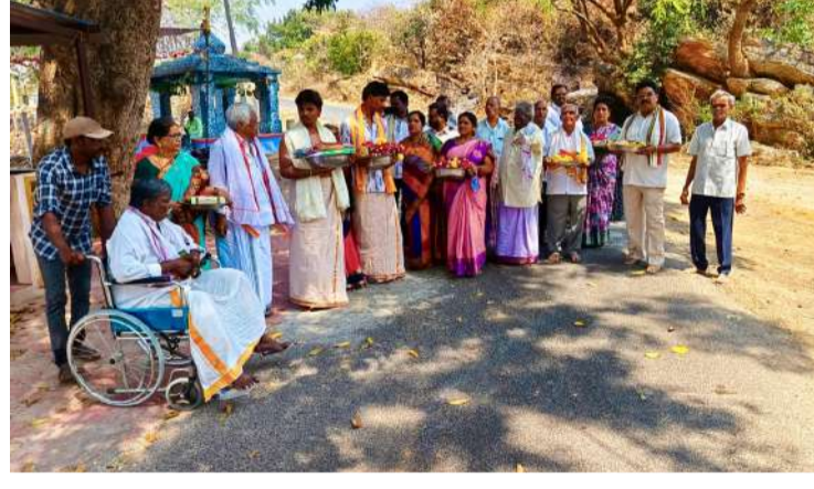
కళ్యాణోత్సవం రోజు వస్త్రాలు, పూలు, పండ్లు సత్రం తరుపున స్వామి వారికి సమర్పించు కార్యక్రమం