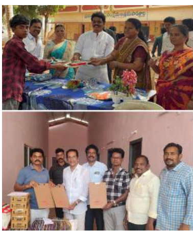
నిలుస్తుందని అన్నారు. విద్యార్థులు క్రమశిక్షణతో చదువుతూ ఉపాధ్యాయులు మరియు తల్లిదండ్రుల ఆశలను నెరవేర్చాలని సూచించారు. కష్టపడి చదివి ఉన్నత స్థాయికి చేరుకోవడం ద్వారా తమ కుటుంబానికి,