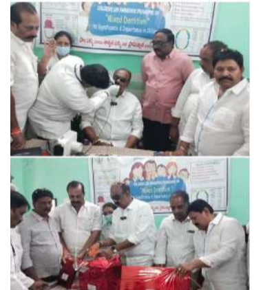
- ప్రభుత్వ ఏరియా హాస్పిటల్ డాక్టర్లపై ఎమ్మెల్యే హాట్ కామెంట్స్ చేశారు.