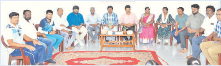
కుప్పం, చిత్తూరు ఎక్స్ ప్రెస్, ఆగస్టు 23: ఆగస్టు 24న జూనియర్ విభాగంలో బాలుర, బాలికల చిత్తూరు జిల్లా షూటింగ్ బాల్ జట్టు ఎంపిక పోటీలు రామకుప్పంలోని డాక్టర్ బి.ఆర్ అంబేద్కర్ గురుకులం పాఠశాలలో ఉంటాయి.