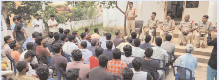
శ్రీకాళహస్తి, చిత్తూరు ఎక్స్ ప్రెస్, ఆగస్టు 23: