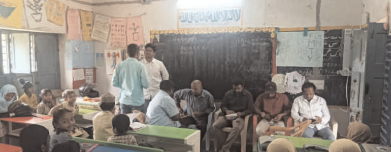
వీ.కోట, చిత్తూరు ఎక్స్ ప్రెస్, ఆగస్టు 23:

వీకోట మండలం మద్దిమగనపల్లి రైతు భరోసా కేంద్రంలో శనివారం రోజు వ్యవసాయ అధికారులు మరియు సచివాలయ సిబ్బంది. అధ్యక్షంలో వరిసాగు పై రైతులకు అవగాహన సదస్సు ఏర్పాటు చేసినారు. ఈ సందర్భంగా అధికారులు రైతులకు సూచనలు సలహాలు ఇస్తూ ఈ సీజన్లో ఒరిస్సాగుకు ఏ దశలో ఎంత నీరు పెట్టాలి, చంటను ఎలా అభివృద్ధి పరచుకోవాలి కంకులు ఎక్కువ దిగుబడి రావడానికి తీసుకోవలసిన జాగ్రత్తల గురించి రైతులకు సలహాలు సూచనలు అందించినారు. ఈ కార్యక్రమానికి గ్రామంలోని రైతులు అత్యధికంగా పాల్గొన్నారు.