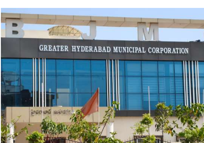
అధికార వ్యవస్థలో అసాధారణ ప్రభావం పెంచుకుని కీలక వ్యక్తిగా ఎదిగాడనే ప్రచారం కొనసాగుతోంది.

విజేత రాజేంద్రనగర్ : రాజేంద్రనగర్ ప్రాంతంలోని జీహెచ్ఎంసి సర్కిల్ కార్యాలయం ప్రస్తుతం తీవ్ర చర్చకు దారి తీస్తోంది. సాధారణంగా కంప్యూటర్ ఆపరేటర్ గా పనిచేస్తున్న ఓ ఔట్ సోర్సింగ్ ఉద్యోగి, కార్యాలయంలో అసాధారణ ప్రభావం చూపుతున్నాడనే ఆరోపణలు వెల్లువెత్తుతున్నాయి. పైళ్ల కదలిక నుంచి కీలక అనుమతుల వరకు అతని మాటే చివరి నిర్ణయంగా మారిందన్న ప్రచారం స్థానిక వర్గాల్లో హాట్ టాపిక్ గా మారింది. స్థానికుల కథనం ప్రకారం, నిర్మాణ అనుమతులు, ఆక్యుపెన్సీ సర్టిఫికేట్లు (ఓసీలు) వంటి కీలక పైళ్ల వ్యవహారాల్లో ఈ ఉద్యోగి ప్రత్యక్ష ప్రమేయం పెరిగిందని చెబుతున్నారు. కార్యాలయంలో అధికారులకంటే అతనికే ఎక్కువ ప్రాధాన్యం లభిస్తోందని, పైళ్లు వేగంగా క్లియర్ కావాలంటే అతని అనుకూలత అవసరమనే అభిప్రాయం బలపడినట్లు సమాచారం.