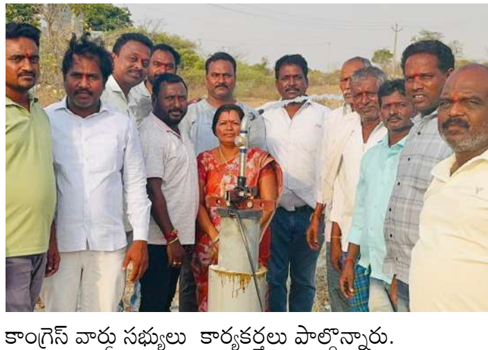
కాంగ్రెస్ వార్డు సభ్యులు కార్యకర్తలు పాల్గొన్నారు.