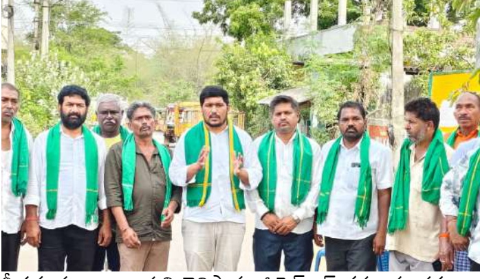
తీవ్రరూపం దాల్చాయని తెలిపారు. ఓపెన్ కాస్ట్ గనులను క్రమంగా తగ్గించి భూగర్భ గనులకు ప్రాధాన్యత ఇవ్వాలని కోరారు.