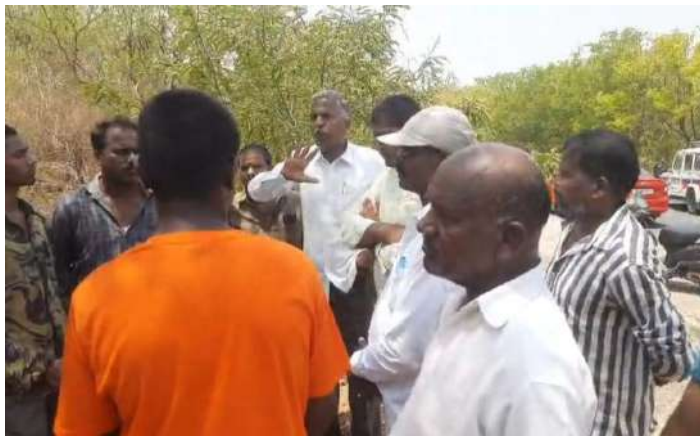
ఆందోళనకు కొనసాగిస్తూ, “ప్రాణాలు పోయినా భూములు వదులుకోము” అంటూ నినాదాలు చేశారు. పరిస్థితి ఉద్రిక్తంగా మారడంతో కోహెడ గ్రామంలో భారీగా పోలీసు బలగాలను మోహరించారు. గ్రామంలో ఉద్రిక్తత కొనసాగుతోంది.

విజేత, ఇబ్రహీంపట్నం : గ్రామంలోని సర్వే నెంబర్లు 582, 583, 584, 588, 589 పరిధిలో ఉన్న 118 ఎకరాల భూమిని ప్రభుత్వం స్వాధీనం చేసుకునే ప్రయత్నం చేస్తోందని రైతులు తీవ్ర ఆందోళన వ్యక్తం చేశారు. ఈ భూముల కోసం తాము దాదాపు 40 సంవత్సరాలుగా పోరాటం చేస్తున్నామని, 118 మంది రైతు కుటుంబాల జీవనాధారం ఈ భూములేనని వారు పేర్కొన్నారు. ఫ్రాట్ మార్కెట్తో పాటు సబ్-రిజిస్టర్ కార్యాలయం నిర్మాణం కోసం భూమిని కేటాయిస్తామని సమాచారం రావడంతో గ్రామానికి చేరుకున్న అధికారులను రైతులు అడ్డుకున్నారు. ఆర్డీవో, ఎమ్మార్వో, మార్కెట్ కమిటీ చైర్మన్లను నిలదీస్తూ తమ భూములను బలవంతంగా తీసుకోవద్దని హెచ్చరించారు. ఈ సందర్భంగా అధికారులకు రైతులకు మధ్య తీవ్ర వాగ్వాదం చోటుచేసుకోగా, గ్రామంలో ఉద్రిక్త వాతావరణం నెలకొంది. భూమి కొలతల కోసం తీసుకువచ్చిన జేసీబీని ముందుకు వెళ్లనియకుండా రైతులు నిరసన చేపట్టారు. ఓ వృద్ధురాలు జేసీబీ ముందు రోడ్డుపై పడుకుని నిరసన వ్యక్తం చేయడం అక్కడి పరిస్థితులను మరింత ఉద్రిక్తంగా మార్చింది. మందుతున్న ఎండలను నైతం లెక్కచేయకుండా రైతులు తమ