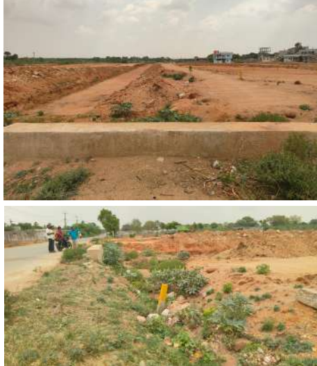
ప్రశ్నిస్తున్నారు. ఇవన్నీ ఏమీ ఆలోచించకుండానే హెచ్ఎండిఏ అధికారులు పర్మిషన్ ఇచ్చారని స్థానిక ప్రజలు ప్రశ్నిస్తున్నారు. తక్షణమే వెంచర్ పై చర్యలు తీసుకొని నిబంధనలను పాటించకుంటే కఠిన చర్యలు తీసుకోవాలని స్థానిక ప్రజలు కోరుతున్నారు. అక్కడ ఎలాంటి ఇబ్బందులు లేకుండా వర్షపు నీరు వెళ్లి విధంగా వెంచర్ నిర్మాణం జరగాలని లేని పక్షంలో వెంచర్ పై కట్టిన చర్యలు తీసుకోవాలని స్థానిక ప్రజలు కోరుతున్నారు.

లేదని స్థానిక ప్రజలు ప్రశ్నిస్తున్నారు. హెచ్ఎండిఏ అధికారులు ఏమీ చూడకుండానే పర్మిషన్ ఇచ్చారా... అక్షిత వెంచర్ ఇష్టానుసారంగా చేసుకుంటూ పోతుంటే ఇక్కడ ప్రజలకు స్థానికులకు ఎన్నో ఇబ్బందులు ఏర్పడుతున్నాయని స్థానిక ప్రజల ఆరోపిస్తున్నారు. ఇటీవల భారీ వర్షం పడినప్పుడు పొట్టి కుంట లోకి మీరు వెళ్లాల్సి ఉండగా అక్కడ వెంచర్ అడ్డుగా ఉండడంతో వర్షం మీరు మొత్తం ప్రధాన రహదారిపై నీరు నిలిచిపోయింది. దీని కారణంగా వాహనదారులకు ప్రజలకు తీవ్ర ఇబ్బందులు ప్రమాదాలు ఏర్పడ్డాయి ఇది ఇలాగే కొనసాగితే భవిష్యత్తులో చాలా ప్రమాదం ఏర్పడుతుందని వెంచర్ నిర్మాణం జరిగి భవిష్యత్తులో అక్కడ ఇల్లు ఏర్పడ్డ మరియు వర్షం కారణంగా ఉంచరు మునిగిపోతే అక్కడ ప్రజల పరిస్థితి ఏమిటి అని స్థానిక ప్రజలు ప్రశ్నిస్తున్నారు. ఇవన్నీ ఏమీ ఆలోచించకుండానే హెచ్ఎండిఏ అధికారులు పర్మిషన్ ఇచ్చారని స్థానిక ప్రజలు ప్రశ్నిస్తున్నారు. తక్షణమే వెంచర్ పై చర్యలు తీసుకొని నిబంధనలను పాటించకుంటే కఠిన చర్యలు తీసుకోవాలని స్థానిక ప్రజలు కోరుతున్నారు. అక్కడ ఎలాంటి ఇబ్బందులు లేకుండా వర్షపు నీరు వెళ్లి విధంగా వెంచర్ నిర్మాణం జరగాలని లేని పక్షంలో వెంచర్ పై కట్టిన చర్యలు తీసుకోవాలని స్థానిక ప్రజలు కోరుతున్నారు.