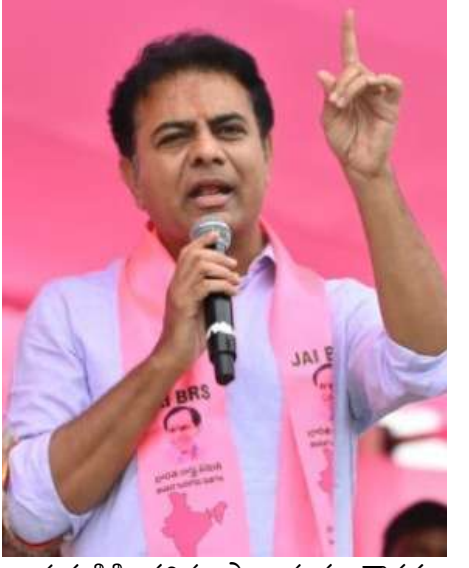
నాయకుడికి తగిన ప్రాధాన్యత, గౌరవం కల్పిస్తామని హామీ ఇచ్చారు.

ఇచ్చారు. గతంలో తెలంగాణకు 24 గంటల ఉచిత కరెంట్ ఇచ్చిన ఘనత కేటీఆర్ దేనని, అదే రీతిలో నగరానికి నిరంతర మంచి నీరు అందించేది కూడా కేటీఆర్ దేనని స్పష్టం చేశారు. కాంగ్రెస్ మార్కు పరిపాలనపై పూర్తి అవగాహన ఉండబట్టి, నగర ప్రజలు గత ఎన్నికల్లో ఆ పార్టీకి ఒక్క సీటు కూడా ఇవ్వలేదని అన్నారు. గత బీఆర్ఎస్ ప్రభుత్వ హయాంలో కేటీఆర్ కట్టిన పై ఓవర్లు, ఆసుపత్రులు, ప్రభుత్వ భవనాలను ఇప్పుడు కాంగ్రెస్ నేతలు ఓపెన్ చేస్తూ.. తామే కట్టామంటూ అబద్ధాలు చెప్పుకుంటున్నారని మండిపడ్డారు. గతంలో తాము కేవలం అభివృద్ధిపైనే దృష్టి పెట్టామని, అయితే ఈసారి అధికారంలోకి వచ్చాక పార్టీ కోసం కష్టపడిన ప్రతి కార్యకర్తకు,