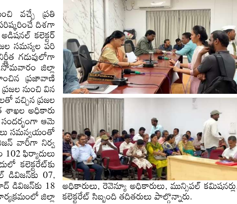
అధికారులు, రెవెన్యూ అధికారులు, మున్సిపల్ కమిషనర్లు, కలెక్టరేట్ సిబ్బంది తదితరులు పాల్గొన్నారు.