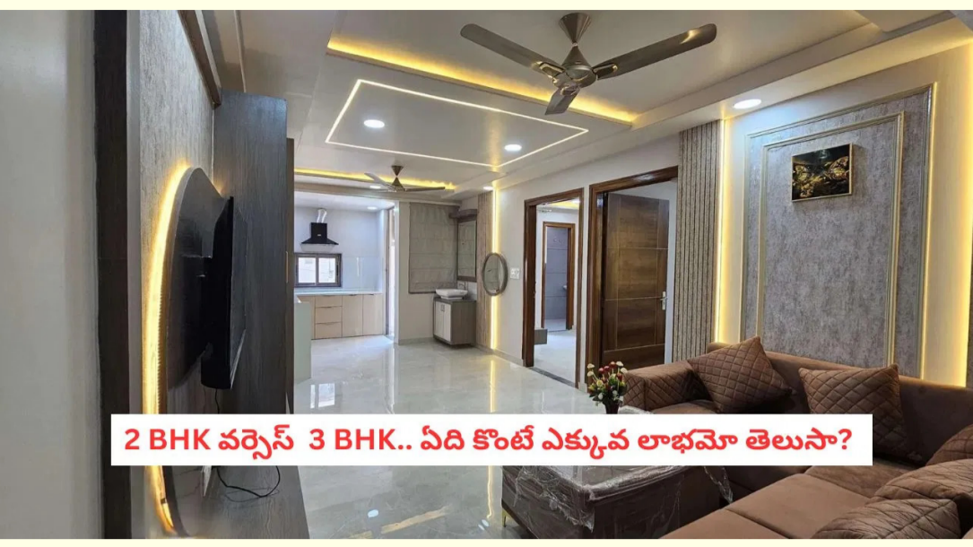
2 BHK వర్సెస్ 3 BHK.. ఏది కొంటే ఎక్కువ లాభమో తెలుసా?

సొంత ఇల్లు అనేది ఒక భావోద్వేగం మాత్రమే కాదు.. అది జీవితకాల పెట్టుబడి కూడా. అయితే ఇల్లు కొనే సమయంలో చాలామంది ఎదుర్కొనే అతిపెద్ద సందిగ్ధం 2 బీహెచ్కే తీసుకోవాలా లేక 3 బీహెచ్కే తీసుకోవాలా అని. తక్కువ ధరలో వస్తుంది కదా అని 2 బీహెచ్కే వైపు మొగ్గు చూపాలా? లేక భవిష్యత్తు అవసరాల కోసం 3 బీహెచ్కే ఎంచుకోవాలా? ఏది మీకు అత్యధిక లాభాన్ని తెచ్చిపెడుతుందో ఇప్పుడు అసలైన లెక్కలో తెలుసుకుందాం. ప్రతి ఒక్కరి జీవితంలో సొంత ఇల్లు ఒక మైలురాయి. ఆర్థిక స్థిరత్వం లభించిన తర్వాత ఇల్లు కొనే -విషయంలో చేసే చిన్న పొరపాటు భవిష్యత్తులో పెద్ద నష్టానికి దారితీయవచ్చు. కేవలం ప్రస్తుత అవసరాలనే కాకుండా, రాబోయే 10-20 ఏళ్ల అవసరాలను, రీసెట్ వాల్యూను దృష్టిలో ఉంచుకుని నిర్ణయం తీసుకోవాలి. 2 బీహెచ్కే, 3 బీహెచ్కే ఇళ్ల మధ్య ఉన్న అభివృద్ధి విశేషాల మీకోసం.