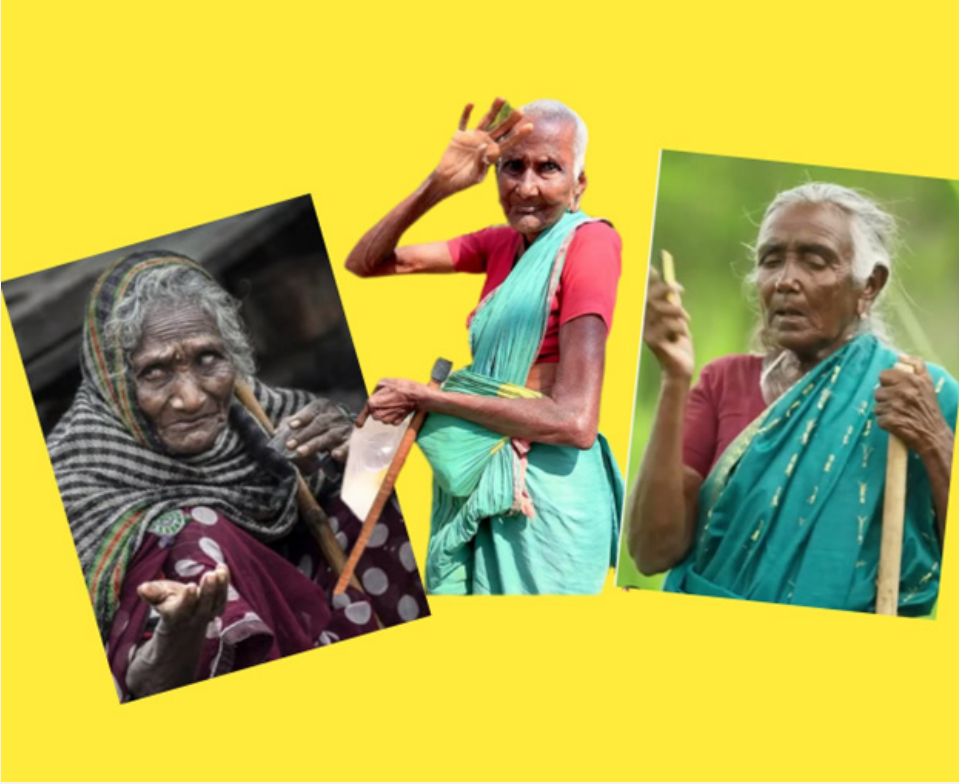
జనోదయ, మంధని ఏప్రిల్ 04:

కాంగ్రెస్ ప్రభుత్వంలో వ్యధులు వితంతులు వికలాంగులు ఒంటరి మహిళల పెన్షన్ల మంజూరుకు అతిగతి లేకుండా పోయింది. 2023లో కాంగ్రెస్ ప్రభుత్వం ఏర్పడ్డ తొలినాళ్లలో ప్రజా పాలన పేరిట ప్రజల నుండి దరఖాస్తులు తీసుకున్నారు. అందులో గ్యాస్, విద్యుత్, ఇళ్లు, పెన్షన్ తదితర సంక్షేమ పథకాలకు 02 జనవరి 2024న దరఖాస్తులు స్వీకరించారు. టిఆర్ఎస్ ప్రభుత్వ హయాంలో 57 సంవత్సరాలు నిండిన వ్యధులకు వృద్ధాప్య పెన్షన్ ఇస్తామని ప్రకటించడంతో 2022 లో వేలాదిమంది దరఖాస్తులు చేసుకున్నారు. వారి వయస్సు ఇప్పుడు 60 దాటింది. అయినా వృద్ధాప్య పెన్షన్లు కాంగ్రెస్ ప్రభుత్వం మంజూరు చేయకపోవడంతో ఆవేదన వ్యక్తం చేస్తున్నారు. ప్రజా పాలనలో మేం ఇచ్చిన దరఖాస్తులు ఏమయ్యాయి యోసని అయోమయానికి గురవుతున్నారా. కార్యాలయాల చుట్టూ పెన్షన్ కోసం తిరిగిన వ్యధులు విసిగి వేసారి ఇక మేం చచ్చాక ఇస్తారా అని దుమ్ముతివోస్తున్నారు. వయసు మీదపడి కాళ్ళు చేతులు అడవి వయసులో పెన్షన్ ఆసరాగా నిలుస్తుందని ఆశపడ్డ వ్యధులకు నిరాశే ఎదురవుతున్నది. కన్నవారి ఆదరణ లేక ప్రభుత్వం కనికరించక ఈ కట్టె ఇలాగే కాలిపోతుందా అని మొరపెట్టుకుంటున్నారు. ఇకవైనా ప్రభుత్వం వ్యధులు వితంతువులు వికలాంగులు ఒంటరి మహిళల పట్ల ప్రత్యేక దృష్టి సారించి నూతన పెన్షన్లు మంజూరు చేయాలని కోరుతున్నారా.