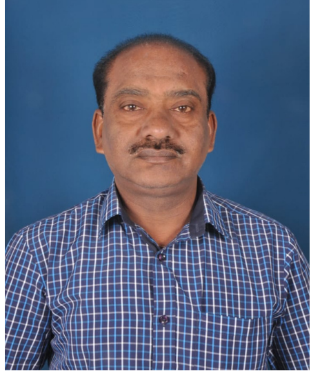
నెంబర్ లో సంప్రదించాలని జిల్లా ఉపాధి అధికారి ఆ ప్రకటనలో పేర్కొన్నారు.