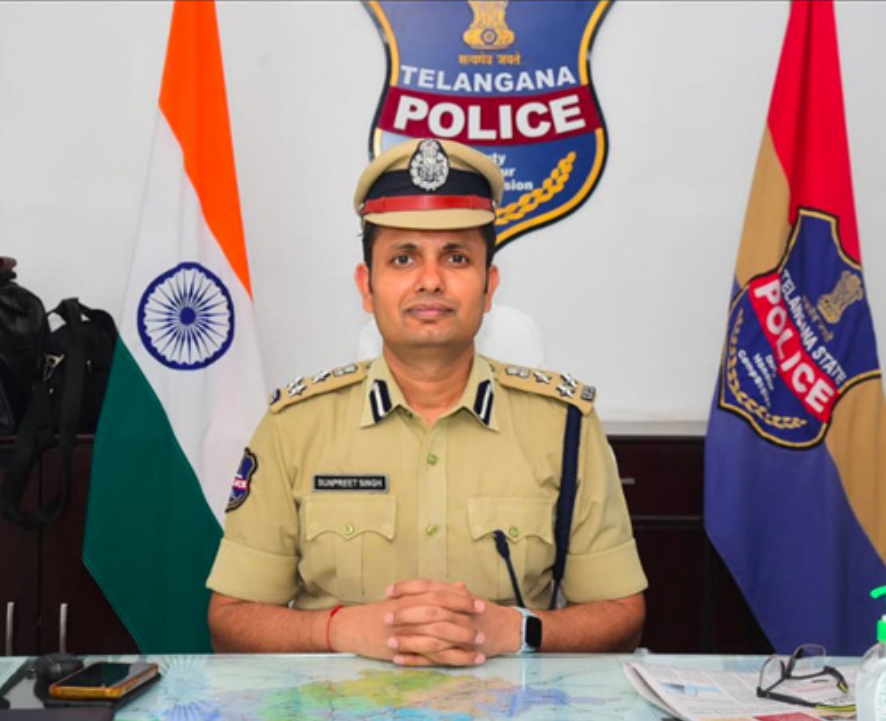
వరంగల్ జిల్లా ప్రతినిధి: ఏప్రిల్ 04 (జనోదయ):

-వరంగల్ పోలీస్ కమిషనర్ సీన్ ప్రీత్ సింగ్, ఐపిఎస్