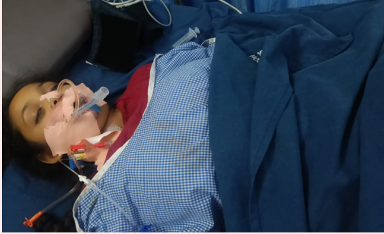
జనోదయ చెన్నూర్ ఆర్ సి ఏప్రిల్ 04 :