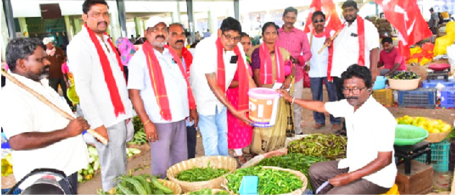
వరంగల్ జిల్లా ప్రతినిధి: ఏప్రిల్ 04 (జనోదయ) :

భారత కమ్యూనిస్టు పార్టీ సిపిఐ వరంగల్ మండల సమితి అధ్యక్షులతో కూరగాయల మార్కెట్లో సామాజిక నిధి సేకరణ కార్యక్రమం నిర్వహించారు. ఈ సందర్భంగా మాట్లాడుతూ.. నిరంతరం పేద ప్రజల హక్కుల కోసం సమాజంలో దోపిడీ, పీడనలేని వ్యవస్థ అయినా సోషలిజం లక్ష్యంగా కమ్యూనిస్టు పార్టీ అనేక పోరాటాలను నిర్విఘ్నంగా నిర్వహిస్తుంది. అసంబంధ