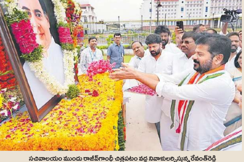
సచివాలయం ముందు రాజీవ్ గాంధీ చిత్రపటం వద్ద నివాళులర్పిస్తున్న రేవంత్ రెడ్డి

ఇందిరాగాంధీ హయాంలో పాక్ కు గట్టి గుణపాఠం చేతగానితనాన్ని కప్పిపుచ్చుకునేందుకే రావాలిపై విమర్శలు దేశ భద్రత, సమగ్రత విషయంలో జవాబుకు అందగా ఉంటాం రాజీవ్ గాంధీ వర్తం కార్యక్రమంలో సీఎం రేవంత్ రెడ్డి వ్యాఖ్యానించారు. బుధవారం మాజీ ప్రధాని రాజీవ్ గాంధీ వర్తం పురస్కారం పొందిన సచివాలయం ముందు ఆయన విగ్రహానికి రేవంత్ పుష్పాంజలి ఘటించారు. రాజీవ్ వర్తం రోజున 'ఉగ్రవాద వ్యతిరేక దినం'గా పాటిస్తున్న విషయాన్ని ఆయన గుర్తుచేశారు. ఉగ్రవాదంపై పోరాటం చేయడం ప్రతి భారతీయుడి దృఢ సంకల్పమన్నారు. దేశ భద్రత, సమగ్రతను కాపాడే విషయంలో రాజకీయాలకు తాప లేకుండా కేంద్ర ప్రభుత్వానికి, భారత వీర జవాబుకు ఎప్పుడూ అండగా నిలబడతామని చెప్పారు. కశ్మీర్ లో పర్యాటకులపై కాల్పుల ఘటన, ఆపరేషన్ సిందూర్ సందర్భంగా పోరాటం చేస్తున్న వీర సైనికులకు అండగా తెలంగాణ ప్రభుత్వం మొట్టమొదటగా సంఘీభావ ర్యాలీ నిర్వహించిందని గుర్తుచేశారు. తరువాయి 2లో