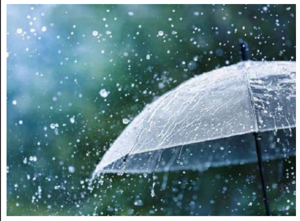
హైదరాబాద్ లో దంచికొడుతున్న వర్షం >> 3లో

దీల్ ఇంటికి.. చివరి స్టెప్ బిచ్చం ముంబయిదే >> 6లో