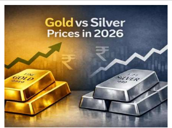
కొండెక్కిన వెండి.. పరుగాపని పసిడి! >> 2లో