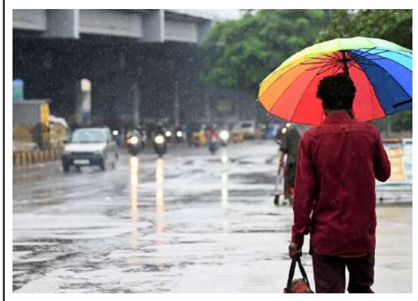
తెలంగాణకు మరోసారి రెడ్ అల్ట్రాస్.. » 3లో అత్యంత భారీ వర్షాలు

ఆ రాష్ట్రంలో భారీగా బయటపడ్డ బంగారు నిక్షేపాలు » 4లో