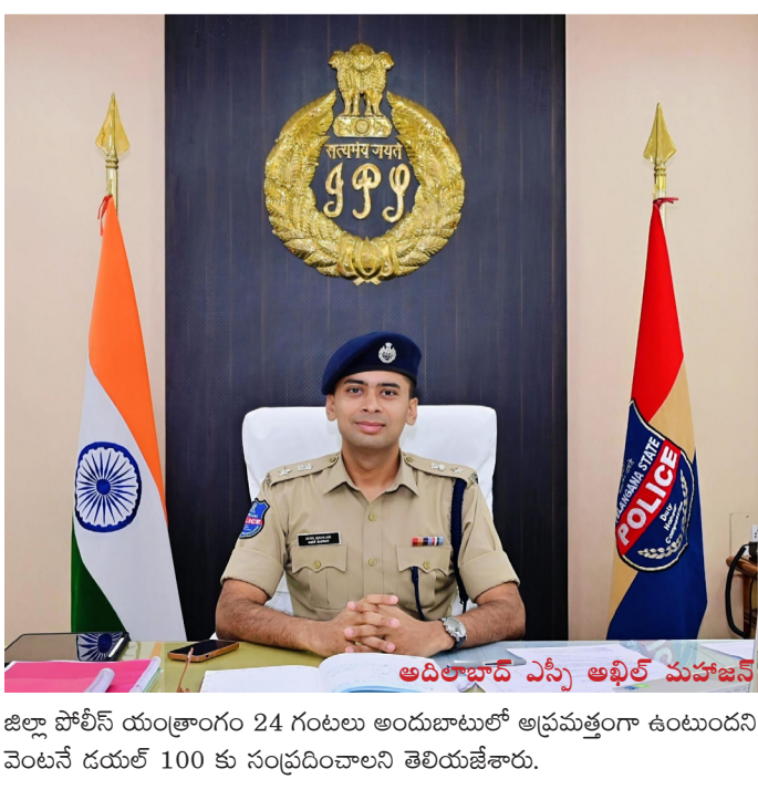
జిల్లా పోలీస్ యంత్రాంగం 24 గంటలు అందుబాటులో అప్రమత్తంగా ఉంటుందని వెంటనే డయల్ 100 కు సంప్రదించాలని తెలియజేశారు.