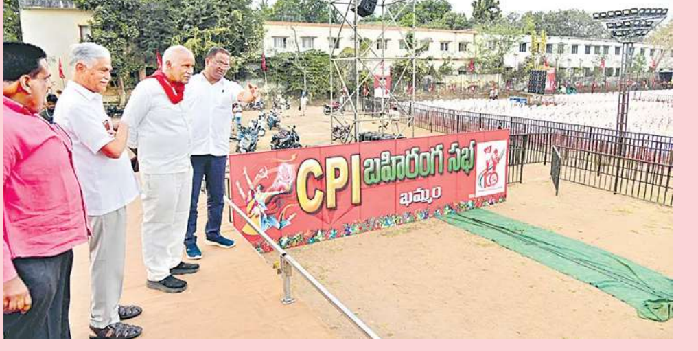
మొదటి పేజి తరువాయి