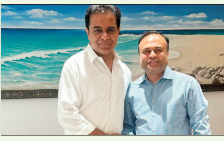
హైదరాబాద్, డిసెంబర్ 11 (మనసలో మాట):

ఎక్స్ వేదికగా శుభాకాంక్షలు తెలిపిన బీఆర్ఎస్ వర్కింగ్ ప్రెసిడెంట్ సాధారణ స్థాయి నుంచి బ్రిటిష్ ఎగువ సభ వరకు.. మీ ప్రయాణం స్ఫూర్తిదాయకం ఇంగ్లాండ్ రాజు చేతుల మీదుగా నామినేట్ కావడంపై హార్షం