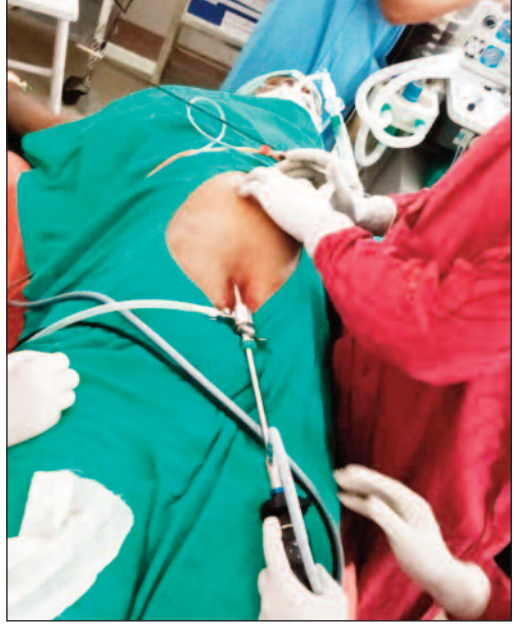
పెద్దపల్లి, డిసెంబర్ 11 (మనసలో మాట):