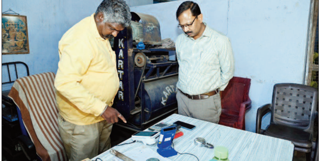
నిజామాబాద్, డిసెంబర్ 11 (మనసలో మాట):