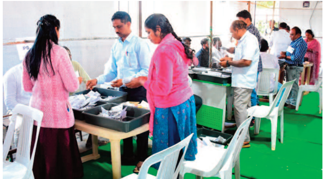
మండలాల వారీగా ఓటర్లు.. నమోదు అయిన పోలింగ్ శాతం..

నిరిసిల్ల: గ్రామ పంచాయతీ ఎన్నికల నేపథ్యంలో మొదటి ఫేజ్ ఎన్నికల పోలింగ్ 79.57 శాతం నమోదు అయింది. చంద్రర్షి, కోనరావుపేట, రుద్రంగి, వేములవాడ అర్బన్, వేములవాడ రూరల్ మండలాల్లో గురువారం పోలింగ్ నిర్వహించారు. ఐదు మండలాల్లో కలిపి మొత్తం 1,11,148 ఓట్లు ఉండగా, 88,442 పోల్ అయ్యాయి. మధ్యాహ్నం ఒంటి గంట వరకు 79.57 శాతం పోలింగ్ నమోదు అయింది.