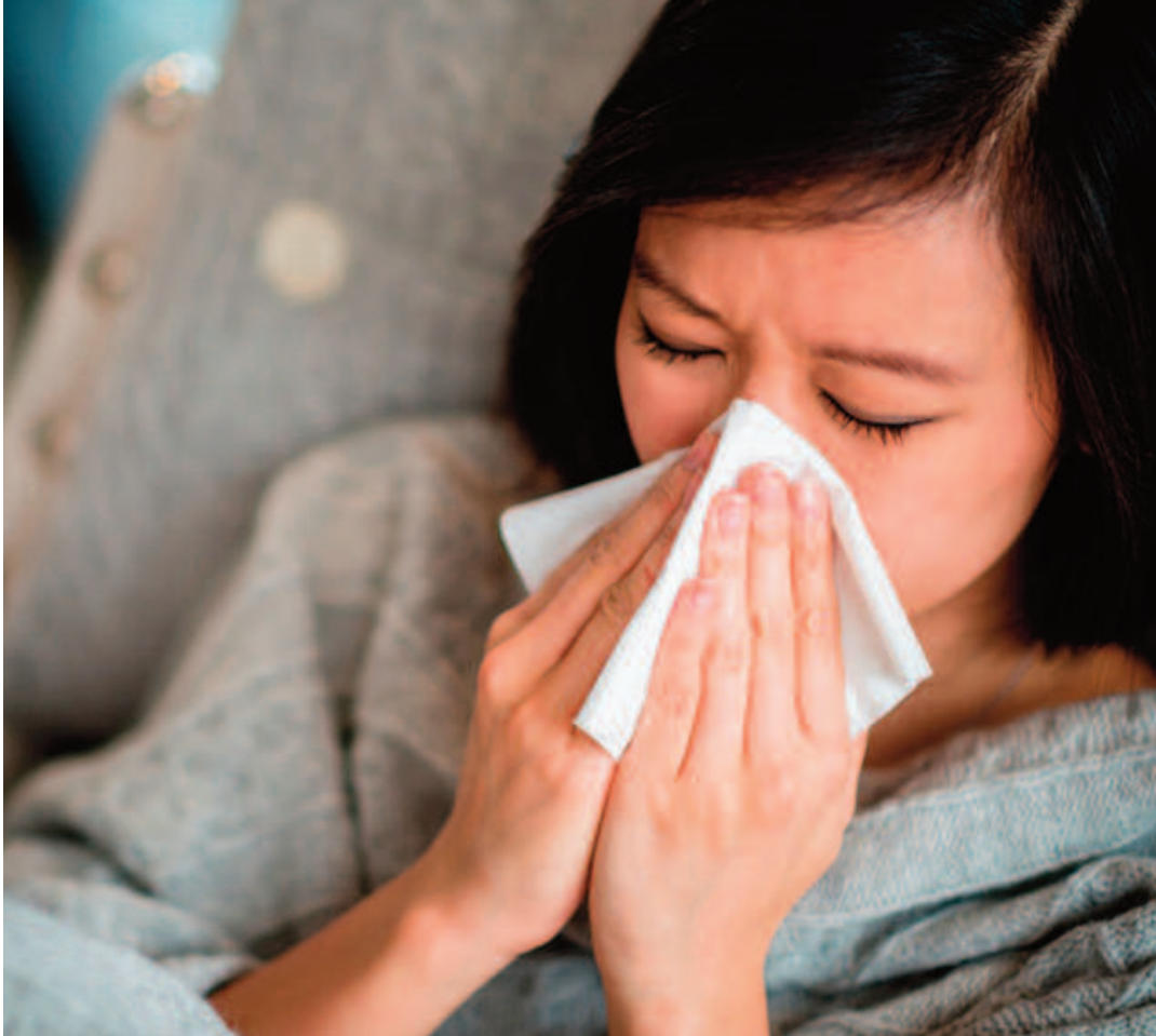
శక్తి తగ్గుతుంది. అధిక చక్కెర, ఉప్పు, వేయించిన ఆహార పదార్థాలను నివారించండి. తగినంత పండ్లు, కూరగాయలు, ప్రోటీన్, నీరు తాగడం చాలా అవసరం. ▶ నిద్ర లేకపోవడం వల్ల రోగనిరోధక శక్తి బలహీనపడి ఇన్ఫ్లెక్షన్ల వచ్చే అవకాశం ఎక్కువగా ఉంటుంది. రోజుకు కనీసం 7 గంటలు నిద్ర అవసరం.