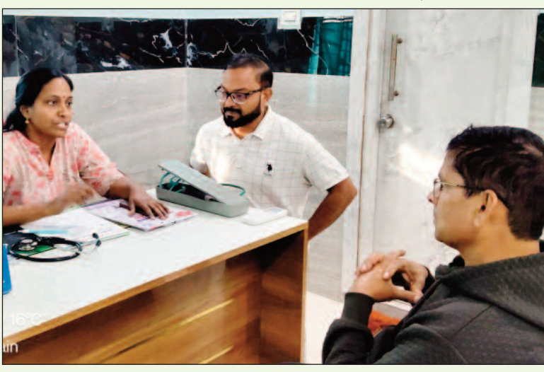
కొత్తగూడెం/పాల్వంచ, డిసెంబర్ 11 (మనసలో మాట):

రిసిప్షన్ లో ధరల జాబితా, డాక్టర్ల వివరాలు డిస్ప్లే చేయాలి పాల్వంచలో డీఎంహెచ్ఎస్ తుకారాం ఆకస్మిక తనిఖీ నిబంధనలు ఉల్లంఘిస్తే సీరియస్ యాక్షన్