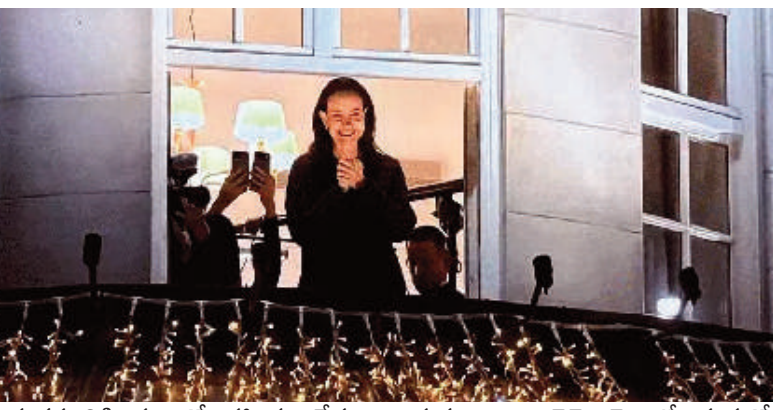
కార్యక్రమానికి మచాడో హాజరుకాలేదు. అవుతున్నాయి. వెనెజువెలాలో మచాడో దీంతో ఆమె కుమార్తె నోబెల్ బహుమతిని స్వీకరించారు. ఇక ఈ కార్యక్రమం జరిగిన కొన్ని గంటల్లోనే మచాడో అజ్ఞాతం వీడి పట్టికోటికి వచ్చారు. ఇందుకు సంబంధించిన ఫోటోలు, వీడియోలు ప్రస్తుతం వైరల్ అవుతున్నాయి. వెనెజువెలాలో మచాడో నియంతృత్వ పాలనకు వ్యతిరేకంగా అనేక ఏళ్లుగా సాగుతున్న ప్రజాస్వామ్య అనుకూల ఉద్యమానికి మచాడో సారథ్యం వహిస్తున్నారు. ఆమె బెదిరింపులను ఎదుర్కోవడమే కాక అరెస్టు కూడా అయ్యారు. ప్రయాణ

నార్వేలో ప్రత్యక్షమై.. మద్దతుదారులకు అభినందనం తల్లి తరపున ఓస్లోలో అవార్డు స్వీకరించిన కూతురు న్యూఢిల్లీ, డిసెంబర్ 11: ఈ ఏడాది ప్రతిష్టాత్మక నోబెల్ శాంతి బహుమతి గ్రహీత, వెనెజువెలా విపక్ష నేత మరియు కొరినీ మచాడో అజ్ఞాతం వీడారు. దాదాపు ఏడాది పాటు అజ్ఞాతంలో ఉన్న ఆమె తాజాగా నార్వేలో ప్రత్యక్షమయ్యారు. నార్వేలోని ఓ హోటల్ వద్ద బహిరంగంగా కనిపించారు. ఈ వేరకు తన మద్దతుదారులకు అభినందనం చేశారు. కాగా, ఈ ఏడాది నోబెల్ బహుమతి మచాడోను పరిచిన విషయం తెలిసింది. బుధవారం నార్వే రాజధాని ఓస్లోలో ప్రధానోత్సవ కార్యక్రమం అంతిమంగా జరిగింది. ఈ