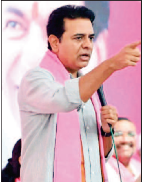
హైదరాబాద్, డిసెంబర్ 11 (మనసలో మాట):

కేంద్ర ప్రభుత్వం ప్రతిపాదిస్తున్న నూతన విత్తన బిల్లు ముందుగాను భారత రాష్ట్ర సమితి (బీఆర్ఎస్) తీవ్రంగా వ్యతిరేకిస్తోంది. ఇది పూర్తిగా రైతు వ్యతిరేకమని, కార్పొరేట్ కంపెనీలకు లాభం చేకూర్చేలా ఉందని బీఆర్ఎస్ వర్కింగ్ ప్రెసిడెంట్ కేటీఆర్ మండిపడ్డారు. ఈ బిల్లును తక్షణం నిలిపివేసి.. రైతు సంఘాలు, వ్యవసాయ నిపుణులు, రాజకీయ పార్టీలతో కూలంకషంగా చర్చించిన తర్వాతే ముందుకెళ్లాలని కేంద్రాన్ని డిమాండ్ చేశారు. కేంద్రం ప్రతిపాదించిన డ్రాఫ్ట్ పార్టీ తరపున ఆయన సుదీర్ఘమైన ఫీడ్ బ్యాక్ను పంపించారు. కార్పొరేట్ల కోసమేనా ఈ చట్టం? 'కాజ్ ఆఫ్ బిజినెస్' పేరుతో