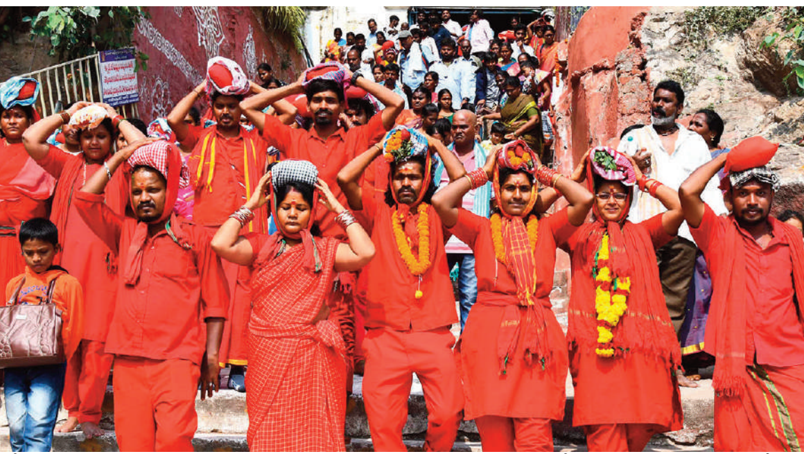
ప్రత్యేక క్యూ లైన్లు, వెయిటింగ్ హాల్స్, తెలిపారు. 950 మంది క్షురకులు 4,000 అదనపు పార్కింగ్, 19 ప్రసారం కౌంటర్లను ఏర్పాటు చేశామని వెల్లడించారు. ఏపీ నలుమూలల నుంచి 7 లక్షల మంది భక్తులు వస్తారని అంచనా వేస్తున్నామని చెప్పుకోవచ్చు. లక్షలాదిగా తరలివచ్చే భవానీలకు తాగునీరు, ప్రసాదం కొరత లేకుండా అందించేందుకు ఏర్పాట్లు చేశామని తెలిపారు. 950 మంది క్షురకులు 4,000 మంది పోలీసు సిబ్బంది, 370కు పైగా సీసీ కెమెరాలతో భద్రతను పటిష్టం చేశామని పేర్కొన్నారు. అన్ని అర్చిత సేవలు డిసెంబర్ 11వ తేదీ నుంచి 16వ తేదీ వరకు నిలిపివేశామని తెలిపారు. గిరి ప్రదక్షిణ మార్గంపై వివరాలను అందించే భవానీ దీక్ష 2025 మొబైల్ యాప్ ను ఏర్పాటు చేశామని వెల్లడించారు. 9 కిలోమీటర్ల మేర గిరి ప్రదక్షిణ ఏర్పాటు చేశామని చెప్పుకోవచ్చు. భక్తులకు ఎప్పటికీ పుడు మానిటరింగ్ చేసే విధంగా కమాండ్ కంట్రోల్ రూం ఏర్పాటు చేశామని అన్నారు. సామాన్య భక్తుడికి పెద్దపీఠం వేశామని.. భవానీల కోసం ఉచిత క్యూలైన్లు ఏర్పాటు చేశామని పేర్కొన్నారు.